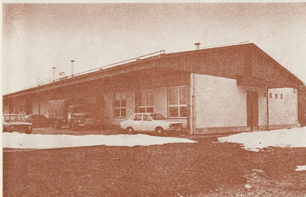
Pekarna v Črnomlju