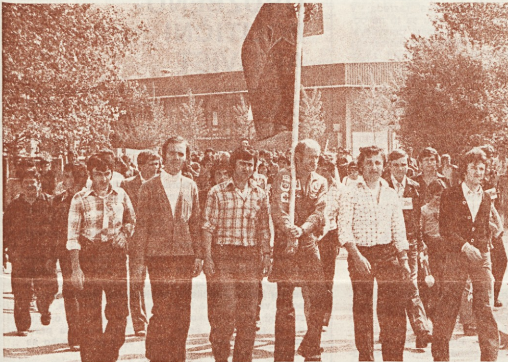
Tudi letos smo se udeležili pohoda Po poteh partizanske Ljubljane in seveda piknika v Bistri

143 delavcev ŽITA se je letos prijavilo za pohod po poteh partizanske Ljubljane, torej največ, odkar se udeležujemo te množične manifestacije. Žal se niso potem vsi zares odločili, da bi prehodili 10 km dolgo pot prijateljstva in spominov. Zakaj ne? Morda zato, ker je bila prosta sobota?