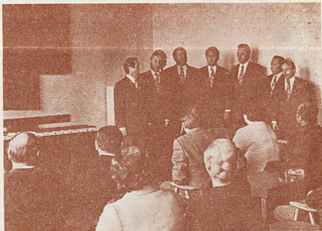
Odlikovancem je zapel Slovenski oktet

Preko organov družbenega upravljanja mora ZSMS vplivati na politiko kulturnih institucij in se v skladu z usmerjenostjo ZK boriti za interese mladih.