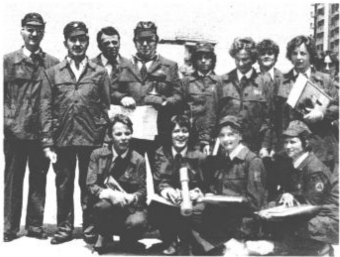
Iz šoštanjskih termoelektrarn sta bili kar dve ekipi