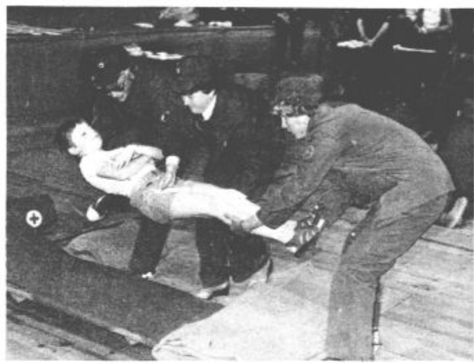
Vse ekipe so se še zlasti izkazale v praktičnem delu