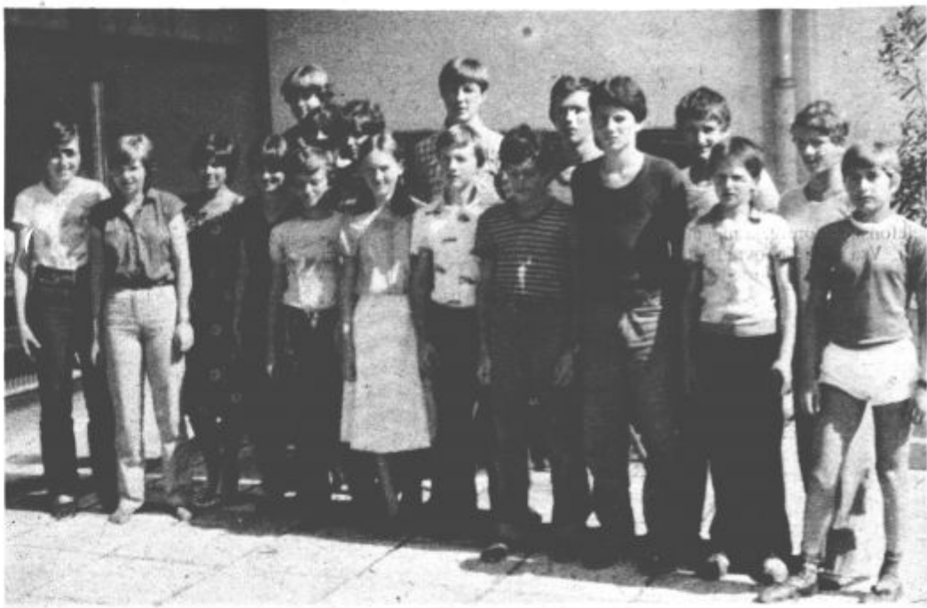
8. a razred osnovne šole LJUBNO: