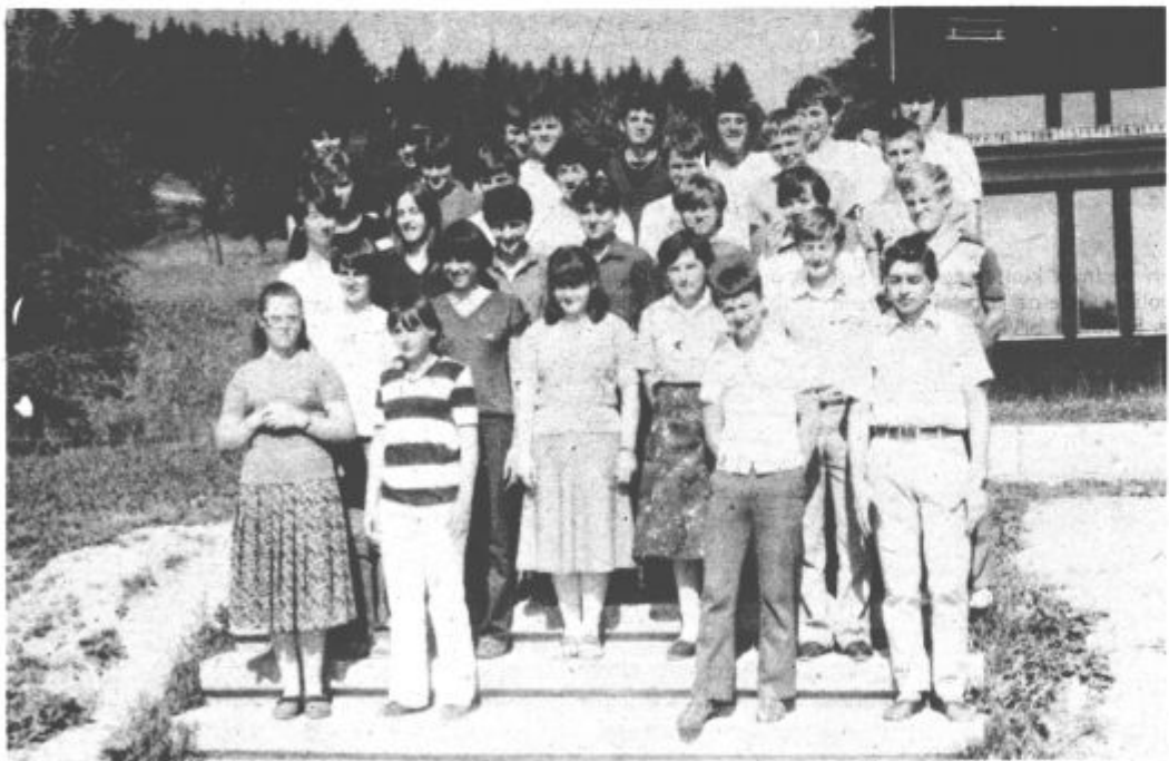
8. b razred osnovne šole MOZIRJE: