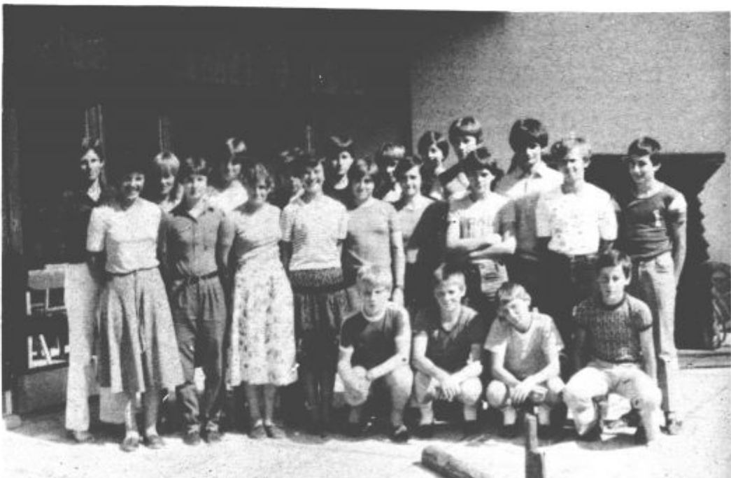
8. b razred osnovne šole LJUBNO: