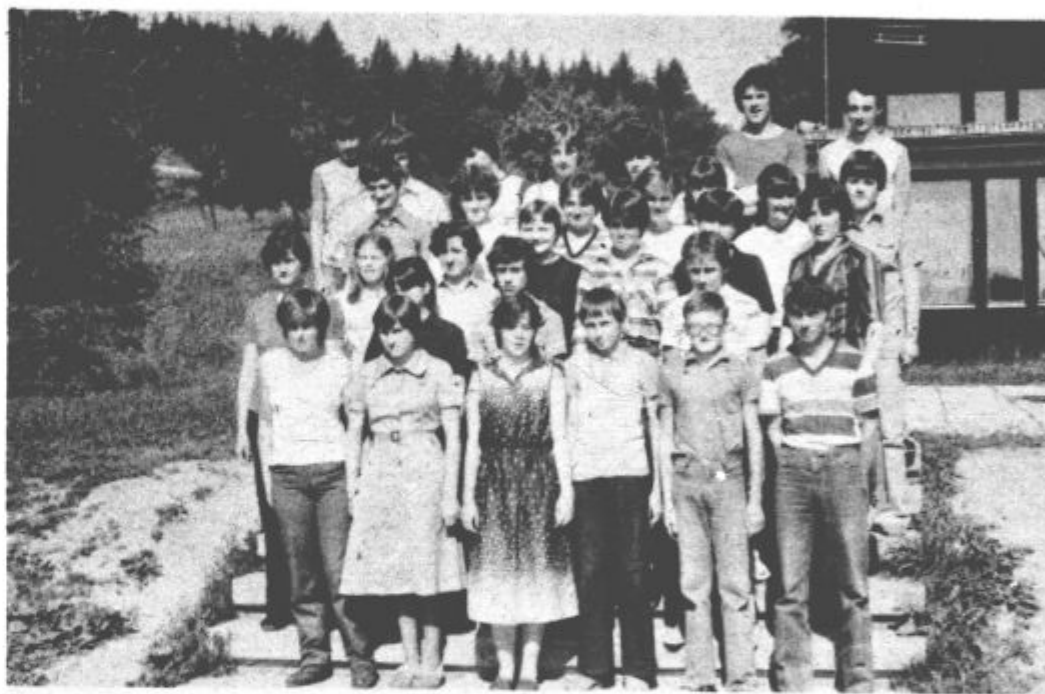
8. c. razred osnovne šole MOZIRJE: