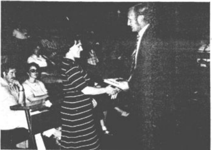
SLOVESNOSTI ZA MLADE STARŠE — Otroci so gotovo v življenju slehernega človeka eno najlepših doživetij. Težko ga pričakujemo, veselimo se vsakega njegovega napredka, radostni smo ob njegovem odrasčanju. Cestitkam ob rojstvu otroka se pridružuje tudi Skupščina občine Velenje, ki je z letošnjim letom pričela organizirati svečanosti, na katere povabijo vse mlade starše. Pripravijo jim krajši kulturni program, jim čestitajo ob rojstvu njihovega otroka ter jim podelijo knjigo Naš malček, ki jim je v pomoč pri negi in vzgoji otroka.