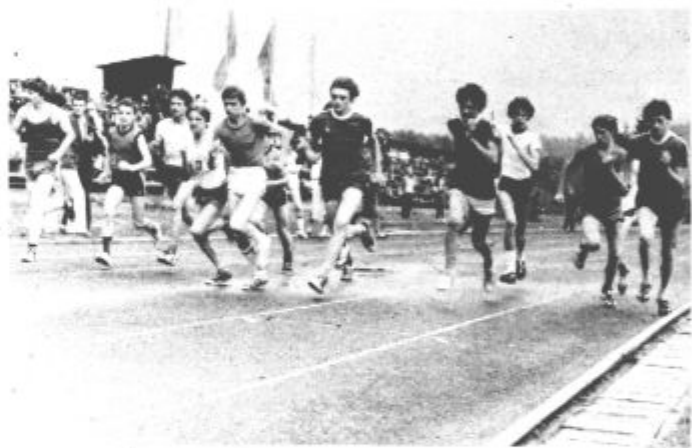
Boj do zadnjih metrov

Slovesen konec iger so pripravili v prostorih družbene prehrane Rek Velenje, kjer so učenci-pevci in recitatorji z osnovne šole gostieljce pripravili za svoje sovrstnike in njihove mentorje kul-