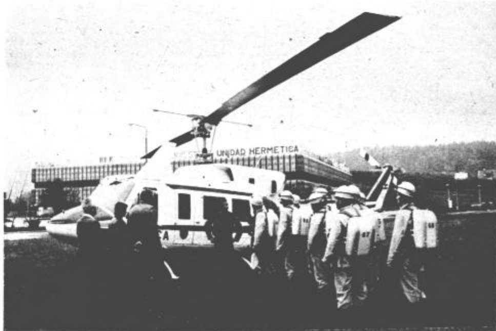
Reševalce je na mesto »nesreče« popeljal helikopter

V soboto je bila v rudniku rjavega premoga v Laškem šesta vaja slovenskih rudniških reševalcev, ki se je udeležilo dvanajst ekip, med njimi tudi dve iz Rudnika lignita Velenje.