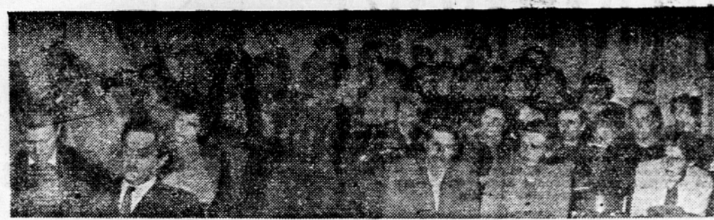
SEJA GLAVNEGA ODBORA ZVEZE ZADRUŽNIC

Beograd, 20. dec. (Tanjug). Odbor za proračun zveznega zbora zvezne ljudske skupščine je osvojil predlog izdatkov državnega sekretariata za narodno obrambo, državnega sekretariata za posle splošne uprave in proračun javnega tožilstva. Prav tako so odobrili predloge izdatkov nacionalnih komisij za UNESCO in mednarodno organizacijo dela, nacionalnega komiteja za kmetijstvo in prehrano (FAO) ter komisije za sodelovanje s mednarodnimi zdravstvenimi organizacijami. Razen tega so razpravljali in odobrili predloge izdatkov zvezne uprave za investicijsko izgradnjo, uprave pomorstva ter rečnega prometa. Na predlog poverjenika zveznega izvršnega sveta bodo razpravljali o izdatkih uprave carin kasneje zaradi naknadnih zahtev te uprave.