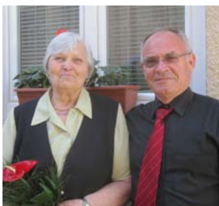
Lunder Jožefa iz Moravč