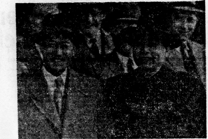
Severnokorejski zunanji minister Nam II in kitajski zunanji minister Ču En Laj.

Pariz, 14. maja. (AFP) Odbor za narodno obrambo je imel danes dopoldne sestanek, na katerem je proučil predloge šefov generalnih štabov glede na zahtevo generala Navarra, naj bi Francija povečala sredstva in vojaške kontingente za Indokino. Kaže, da glede tega niso sprejeli nobenega sklepa.