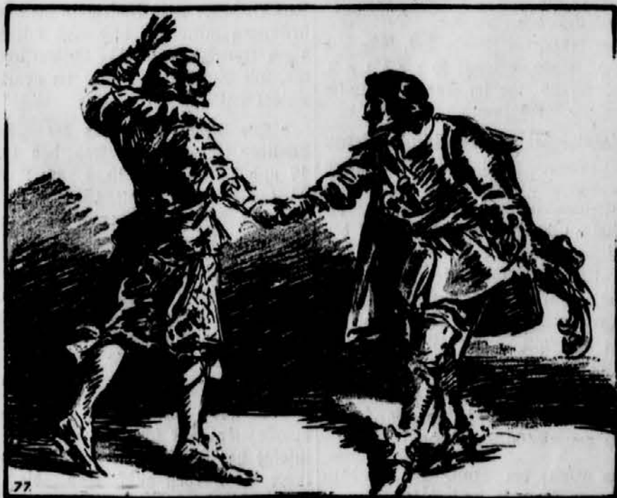
Der Abschied von Buckingham

Eine Stunde später erging die Bekanntmachung, daß kein Schiff im ganzen Königreich nach Frankreich auslaufen dürfe, nicht einmal das Postboot. Ueberall sah man darin eine Kriegserklärung an Frankreich. Zwei Tage später waren die beiden Nesteln fertig und nicht einmal der gewiegteste Kenner hätte sie von zehn alten unterscheiden können. Beim Abschied sprach der Herzog: