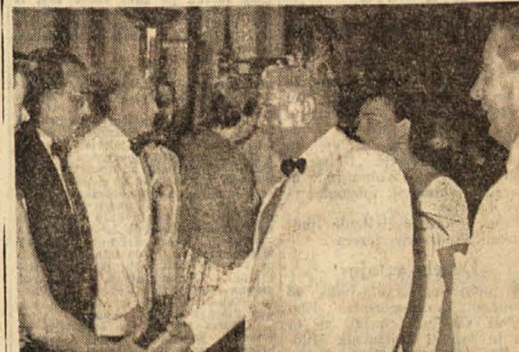
Predsednik Tito med svojimi gosti