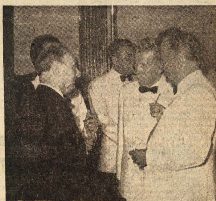
Predsednik Tito in Miha Marinko se na svečanem sprejemu na Bledu razgovarjata s turškim zunanjim ministrom Köprülüjem