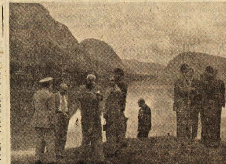
Člani delegacij balkanskih držav so med blejsko konferenco prirejali tudi krajše izlete. Na sliki: skupina delegatov ob Bohinjskem jezeru