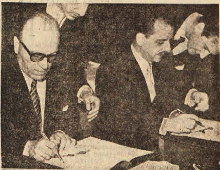
Grški zunanji minister g. Stefanos Stefanopolos in naš državni tajnik za zunanje zadeve Koča Popović podpisujeta pogodbo o zvezi, političnem sodelovanju in medsebojni pomoči med Grčijo, Turčijo in Jugoslavijo