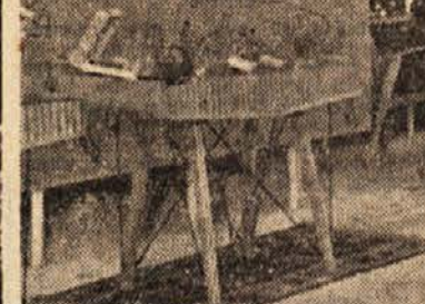
V paviljonu tovarne »Zlatorog« sklepajo pogodbe

Tako je moral letos upravni odbor Mariborskega tedna odgovoriti mnogim podjetjem, ki so želela razstavljati. Razpoložljive