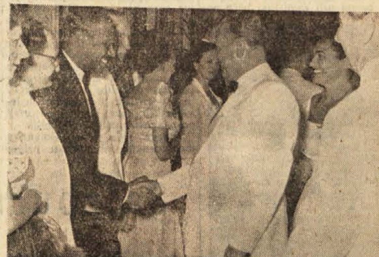
Po podpisu pogodbe je predsednik Tito priredil na Bledu s.ečan sprejem, ki so se ga udeležili člani vseh treh delegacij, diplomatski zbor in drugi gostje. Na sliki: predsednik Tito pozdravlja tuje diplomate