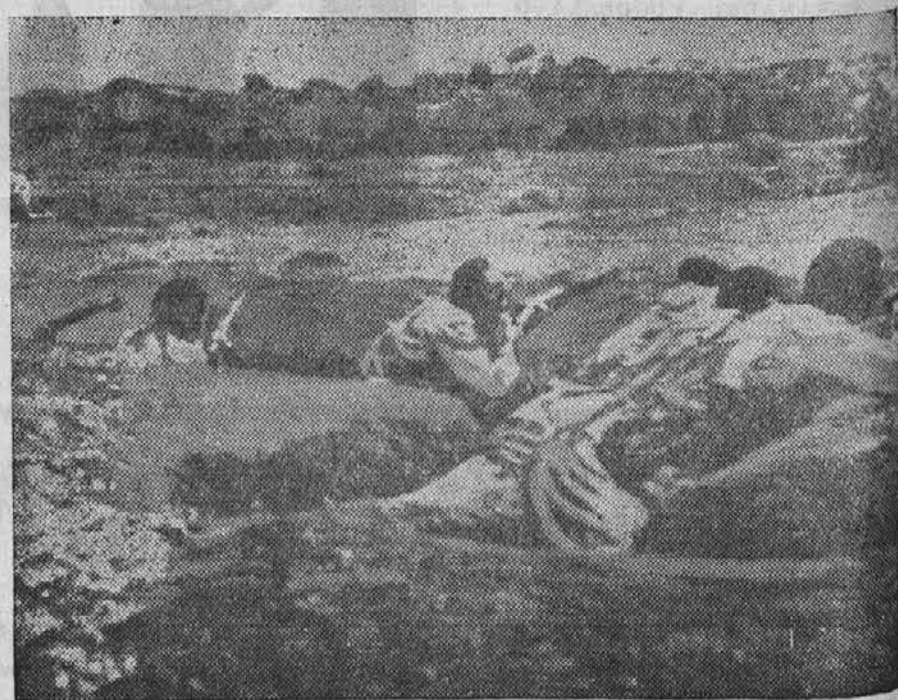
Atesinski vojščaki v strelskih jarkih

P. CAPUDER se priporoča cenjenim rojakom Buenos Aires, Billinghurst 271 dpt. 2 (višina ulice Cangallo 3500)