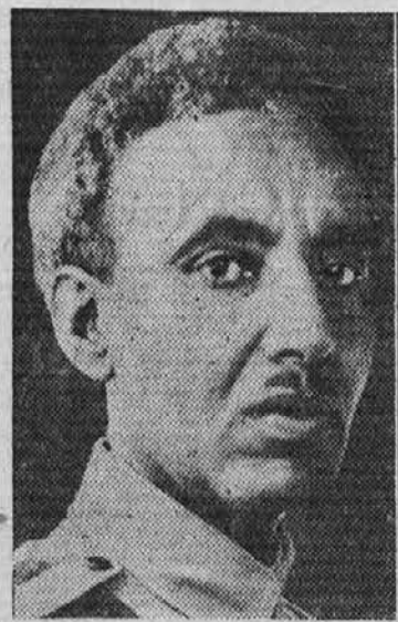
Ras Nasibu poveljuje četam, ki imajo namen ustaviti prodiranje Italijanov v Hararr

Nadaljnji razvoj dogodkov v Evropi je odvisen od tega, kako se bodo sankcije izvajale in pa od možnosti.