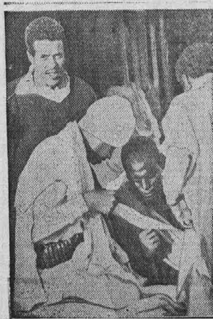
Abesinci čitajo cesarjeva navodila za slučaj zračnih napadov

Od mnogih naših mladih ljudi, ki so že pred mnogimi meseci odinili v Afriko, ni nobenega glasu več in tudi od oblastev ni nobenih pojasnil glede njih usode.