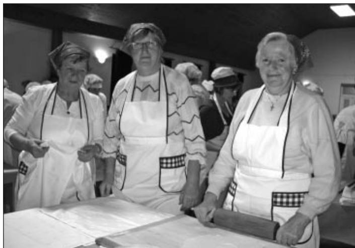
Naše predstavnice v Dražencih