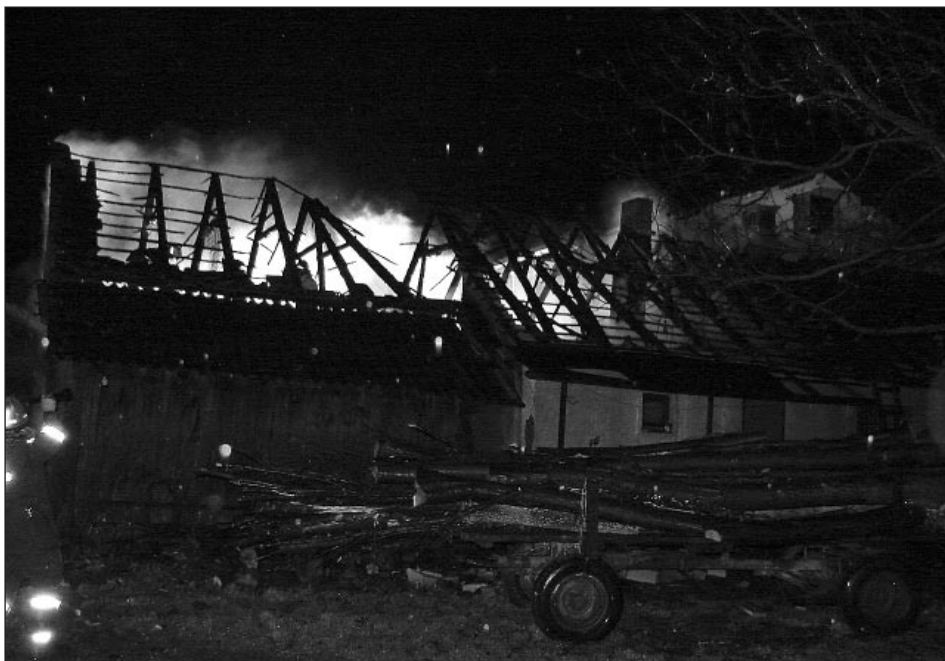
Pogorelo stanovanjsko poslopje v Stojncih