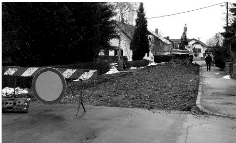
Kanalizacija bo tudi v prihodnje „zaposlovala“ občinski proračun.