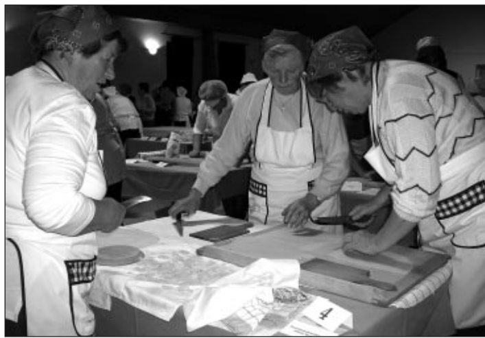
Za dobre rezance sta potreba natančnost in občutek.