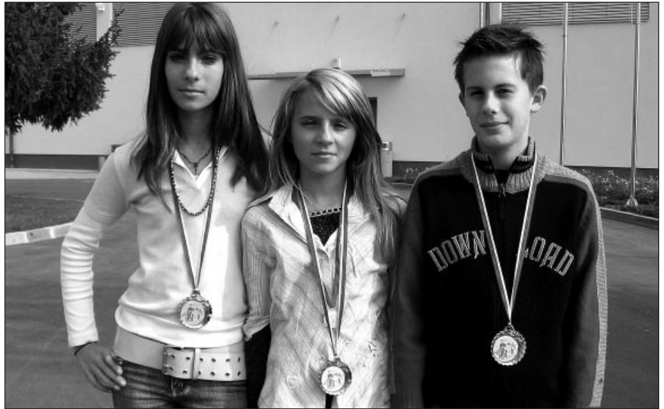
Udeleženci medobčinskega kroša

Potekala pa so tudi športna tekmovanja , kjer naši učenci prav tako niso manjkali.