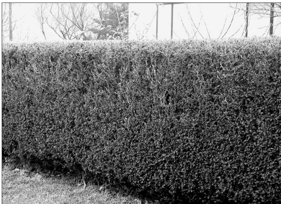
Lastniki morajo poskrbeti, da ograje iz živih mej niso previsoke in da ne ovirajo vidljivosti v cestnem prometu.

Kulturno umetniško društvo Markovski zvon prireja