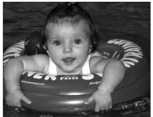
V vodi je tako prijetno.