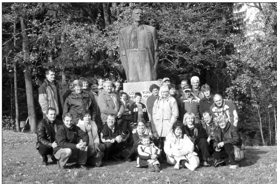
Skupina Stojncanov na izletu