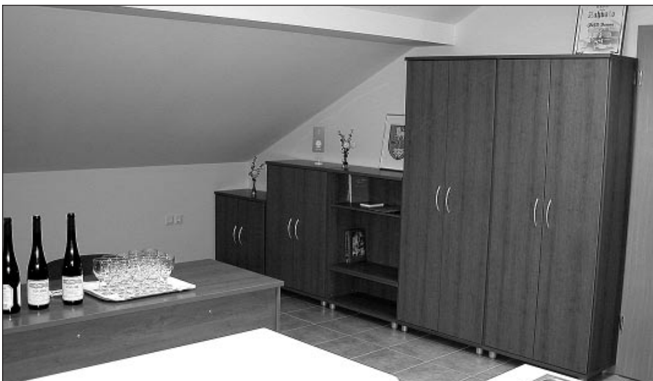
Novi društveni prostori v Borovcih