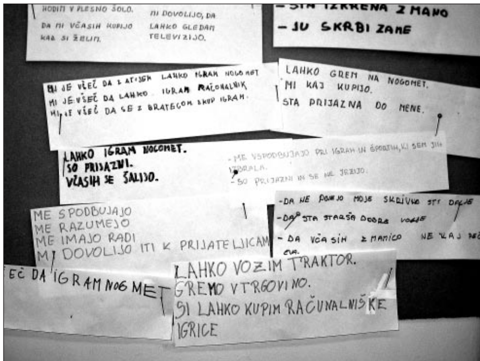
Učenci 5. a so izdelali plakat, Skozi moje oči.