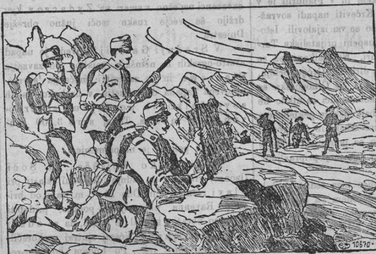
Zusammenstoß zwischen Vorposten im Küstenland

V listu „Wiener Montagszeitung“ objavlja neki znani pisatelj pod naslovom „Resnica o Srbiji“ zanimiv članek, v katerem zanika vorce, da hoče Srbija z nami posebni mir skleniti. Srbija je danes postransko bojna čarar