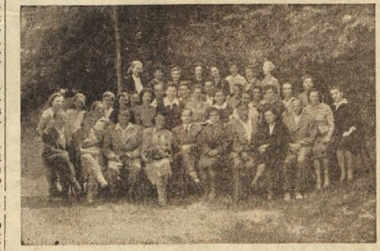
Dva in trideset delavk tovarne perila »TOPER« v Celju je v nedeljo uspešno opravilo prve izpite iz ekonomske vzgoje. Večina mladih deklet je opravila izpite z odličnim uspehom. Sindikalna podružnica je nagradila tečajnice z zabavo na vrtu »Unions«. — Novih tečajev v poletnih mesecih ne bo, vendar pa bo sindikalna podružnica skrbela za redna predavanja o naših novih zakonih in uredbah. V jeseni bodo organizirali nove tečaje, ki jih bodo obiskovale vse delavke, ki še niso opravile izpitov iz ekonomske vzgoje.

Kmetijska zadruga Trate je izdelala v nedeljo 28. junija 1953 tekmo koscev in grablic, ki se je udeležilo nad 500 vaščanov kot gledalcev. Tekmovalcem so razdelili za 25 tisoč dinarjev nagrad iz fonda zadruge za pospeševanje kmetijstva. Zadruga Trate se namreč trudi, da bi pospešila kmetijstvo in izboljšala živinorejo. L. V.