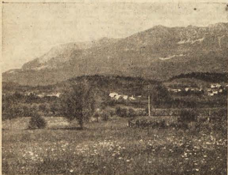
Vipavska dolina — v ozadju pogled na Dobravlje

prgišče debelega in zdravega krompirja. Obraz mu je žarel od zadovoljstva. To je zgodnji krompir; najbolj rani je bil precej drag, potem se je pocenil na 40 dinarjev, sedaj pa kar na 18 din za kilogram. »Kako pa kaže pozni krompir?« — »Če bo po sreči, ga bo okoli 180 stotov na hektar.«