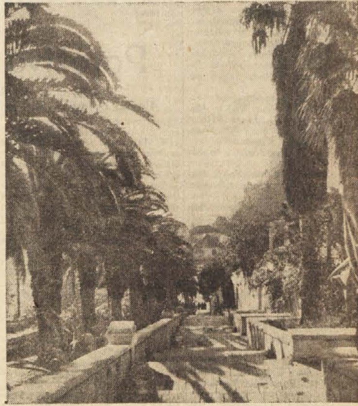
Bujno južno rastlinstvo daje slovitemu obmorskemu letovišču Dubrovniku poseben mlk

S tem je Ljudska skupščina LRS končala svoje V. redno zasedanje.