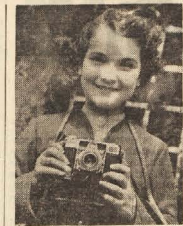
Otroški film 'Pünktchen in Antons'

Kakorkoli že, Williams je v 'Tramvaju' krenil po čudni poti,