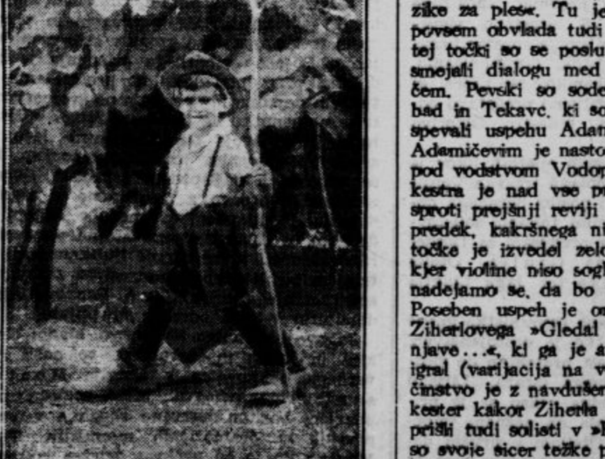
Trogatev se pričinja