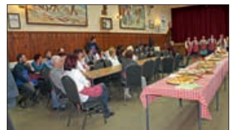
Dve omizji – za levim so sedeli gostitelji, gostje so bili nasproti njim. Na sredini pa priložnost za srečanje ob mizi. Za žejo so poskrbeli kletarji, za ušesa pa pevke KD Skorba.