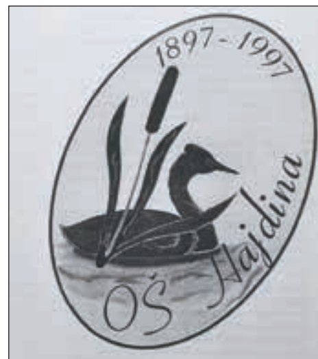
Ponirek, ki je bil naslikan na šolski zgradbi leta 1997.