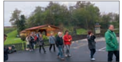
Okolica ribnika Žejnih ribic v Dražencih je marsikoga navdušila za morebitno organizacijo piknika v naravnem okolju.