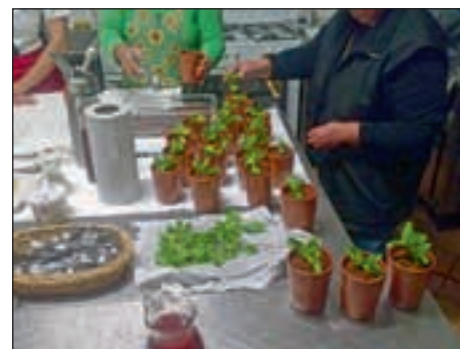
Vrtiček je že skoraj zasajen ...

merjavi s klasičnimi sladicami iz domače kuhinje, vendar je po besedah udeleženk delavnice končni rezultat – užitek v okusu – neprecenljiv.