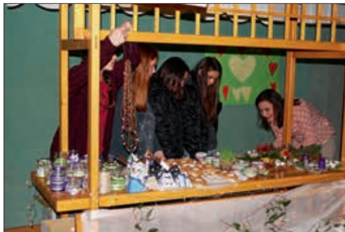
Lepo okrašene stojnice z unikatnimi izdelki so privabljevale obiskovalce.