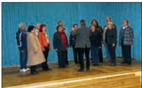
Mešani pevski zbor Društva žena in deklet Gerečja vas je zapel posebej za nas.