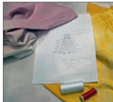
Priprave na krojenje

Za sušenje obarvanih tkanin so članice uporabile kar ograjo na galeriji v dvorani gasilskega doma in jo za nekaj dni spremenile v „sušilnico“.