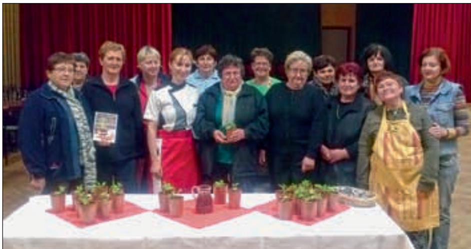
Udeleženske delavnice skupaj z mojstrico in vrtički