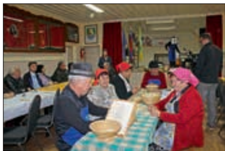
Mini košicnbal v Slovenji vasi