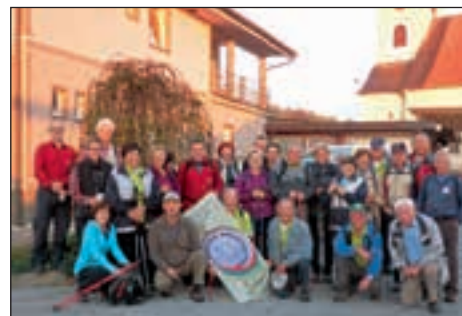
Začetek Slovenjgoriške poti v Vitomarcih

V soboto, 29. novembra, smo nadaljevali Marijino romarsko pot. Tokrat je potekala izpred Marijine cerkve na Ptujski Gori in se je zaključila pri Rudičevem domu na Donački gori. Pot je