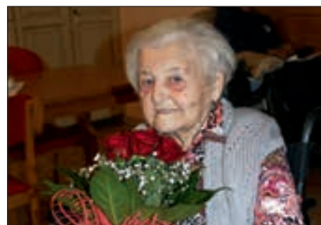
Najstarejša Hajdinčanka ne kaže svojih let.