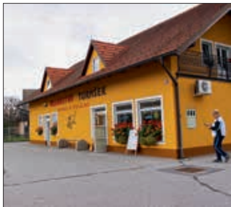
Mesnica Turnšek na Zg. Hajdini je prejela priznanje za najbolj urejen poslovni objekt v letu 2014.