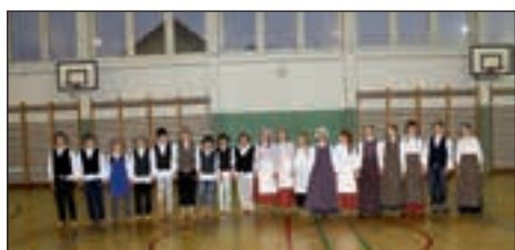
Tako so svoj program zaključili folklorniki OŠ Hajdina.