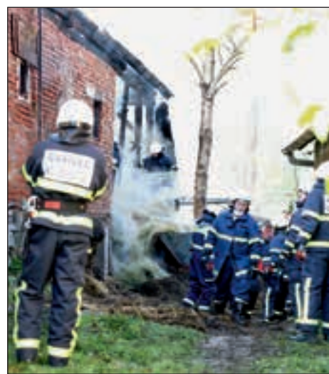
Gasilci na zahtevni intervenciji na Zg. Hajdini

ljevali z razkopavanjem sena in slame. Ves pogoreli material smo vozili na deponijo lastnika. Dostop do objekta je bil z delovnimi stroji nemogoč, zato smo morali gasilci večino dela opraviti ročno. Na intervenciji je bilo prisotnih 70 gasilcev iz 12 PGD. Intervencija je bila zaključena ob 19.45.« TM