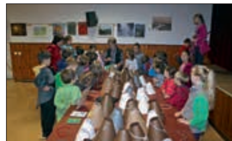
Povedali so, da tudi njihove babice klekljajo.