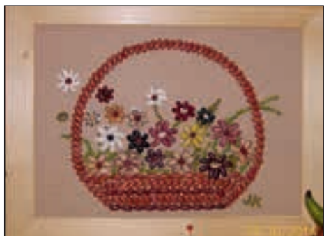
Iz fižola so Hajdošanke ustvarile pisane dekorativne izdelke.