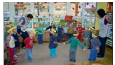
Utrinki z letošnjega tradicionalnega slovenskega zajtrka na Hajdini