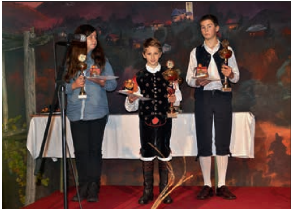
Zmagovalci v skupini do trinajst let

KD Valentin Žumer Hajdoše je letos že 15. zapovrstjo organiziralo nagradno revijo Štajerska frajtonarica, tudi letos v sklopu občinskega praznika v prireditvenem šotoru. V tem času se je na naših odrih zvrstilo že nešteto mladih harmonikarjev, tudi takih, ki so mladi po srcu, vsi pa so s svojim igranjem prispevali k ohranitvi naše kulture.