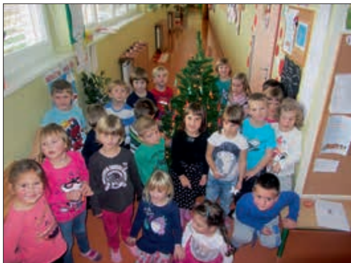
Tudi na zgornjem hodniku smo postavili in okrasili smrekico.