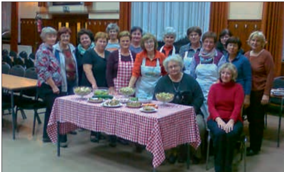
Izobraževalni tečaj za dodatna znanja in nove izkušnje v pripravi jedi po rimskih receptih