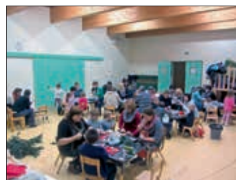
Utrinek z božično-novoletne delavnice s starši rumene igralnice

ta dan darovali tudi prostovoljne prispevke, ki so namenjeni posameznim igranicam za nakup didaktičnih igračk oziroma za namen, za katerega so se starši in vzgojiteljice dogovorili na predhodnih sestankih. Za vse prispevke se zahvaljujemo in prepričani smo, da se bodo otroci vseh novih igračk v igranicah razveselili.