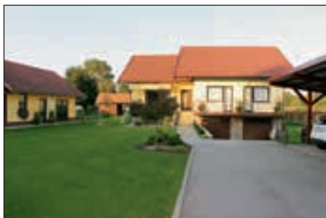
Še eno vrtnico, letos bronasto, je prejela družina Ogrinc iz Skorbe.