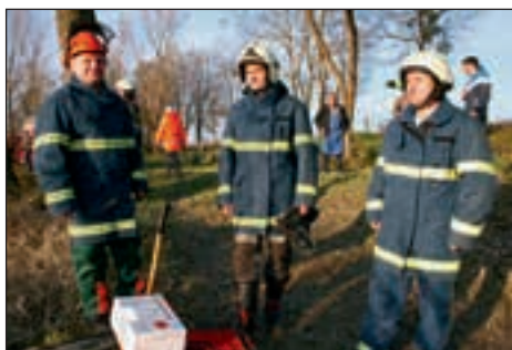
Utrinki z operativne taktične vaje Markovci 2014