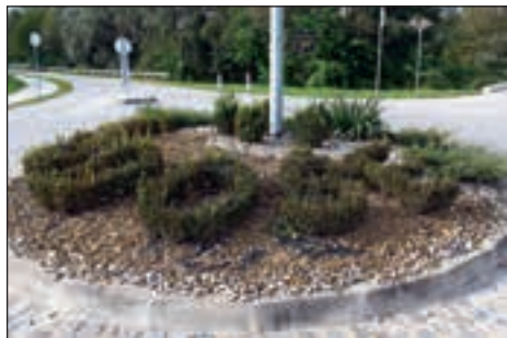
Vaška skupnost Hajdoše je letos zmagala v urejenosti.