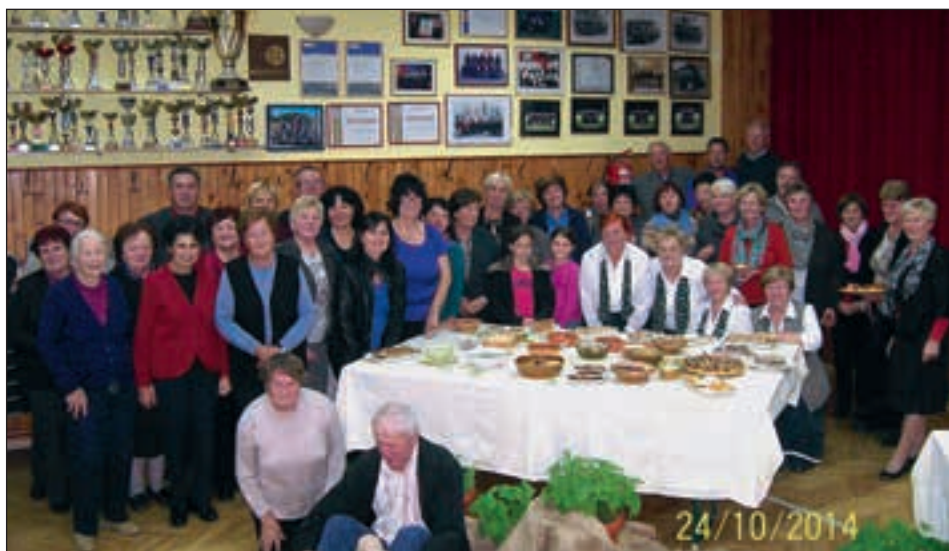
Hajdoške žene v družbi domačinov in gostov na zaključnem srečanju