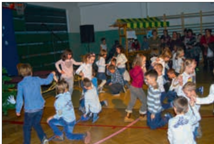
Učenci so pokazali svoje plesne sposobnosti.

nasmehom spominjam vsega od začetka do konca.« Poleg stojnic, na katerih so ponujali unikatne izdelke, je bila tudi stojnica s čajem in stojnica menjalnica, kjer so obiskovalci lahko evre zamenjali za ponirke, ki so simbol šole, in z njimi kupili zelene izdelke. Tako so se eni otroci preizkusili kot bančniki, drugi pa so se ta dan prelevili v natakarje in so goste stregli s pecivom.