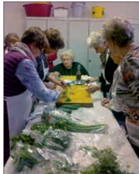
Hajdinčanke se že vrsto let navdušujejo nad rimsko kulinariko.

članice Društva žena in deklet občine Hajdina, pripravile pogostitev v rimskem slogu in tako še stopnjevale po-