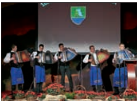
Osrednjo občinsko slovesnost si že težko predstavljamo brez odličnih Štajerskih frajtonarjev.

Minilo je 30 let, odkar je bila v novozgrajenem domu krajanov v Skorbi odigrana prva dramska predstava v treh dejanjih. Od takrat dalje so se na skorbskem odru izoblikovale mnoge generacije igralcev, režiserjev in drugih odrskih delavcev. Skratka, delovanje gledališke skupine Kulturnega društva Skorba je pustilo neizbrisni pečat v okolju, iz katerega so izhajali akterji dramske skupine in širše.