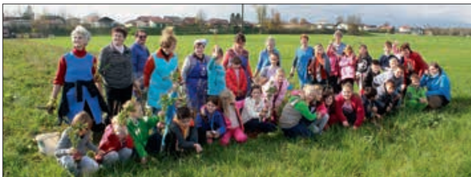
Ena izmed učenk je na njivi našla tudi svojo babico.