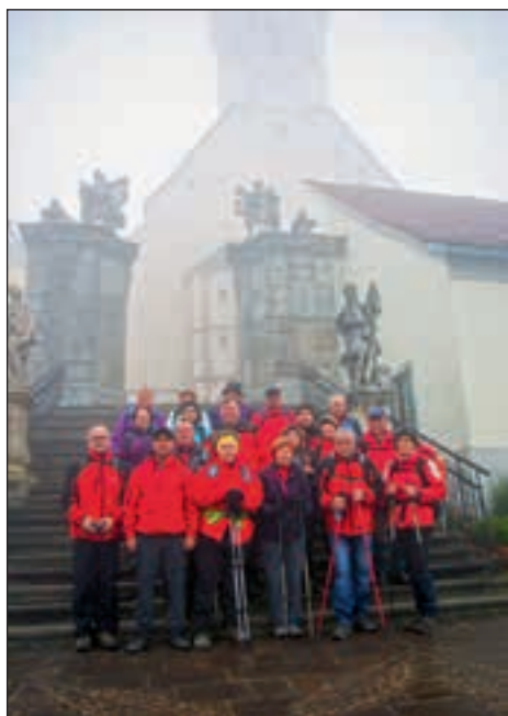
Planinci pred baziliko na Ptujski Gori

Nekaj takšnih doživetij smo članice in člani Planinskega društva Hajdina doživeli na pohodih v jesenskih dneh. Zelo jesensko je bil obarvan pohod po Slovenjgoriški planinski poti, ki je tokrat potekala iz Vitomarcev izpred gostišča Siva čaplja in skozi občino Juršinci vse do Polenšaka, kjer je bil za gostiščem Šegulovih zaključek pohoda s kostanjevim piknikom.