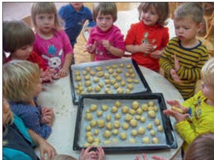
V modri igralnici je dišalo po medenjakah.

videli smo namreč, da njegovi škratki že opazujejo naše pridne in prijazne otroke, in ker znamo res pozorno poslušati, smo slišali, da škratki že zavijajo darila.