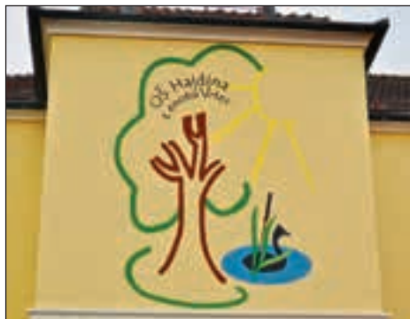
Znak zavoda Osnovne šole Hajdina s PE Vrtec

V septembru 2014 je stari del 117 let stare hajdinske šole dobil novo preobleko. Opravljena je bila energetska sanacija in v teh hladnih mesecih že lahko občutimo toplino, ki nam jo daje nov plašč. Ob samem zaključku smo naš hajdinski hram učenosti še želeli polepšati. Na eno izmed zunanjih sten je bil v novembru naslikan sedanji znak zavoda z drevesom, soncem in ponirkom, ki ga lahko vidite, ko se pripeljete po cesti iz smeri Maribora. Ravno na tem mestu je bil leta 1997 naslikan ponirek.