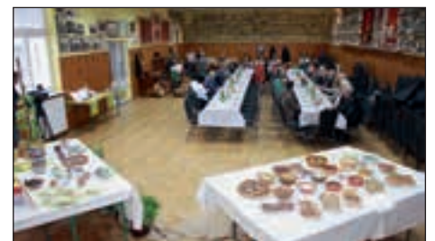
Razstava, pletarji in ženski gasilski raport – vse namenjeno gostom v Hajdošah