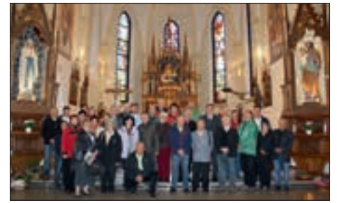
Sv. Martin je bil vesel turističnega obiska.

in počivališča pri kartodromu, od koder se je možno sprehoditi do Berla (naravoslovna učna pot), nato pa po vasi do glavne ceste. Sprejem v dvorani, ki komaj še premore kakšen centimeter zidu, ki ni zapolnjen s priznanji in pokali, je bil gasilsko-gospodinj-sko-pletarski. 60-letno PGD Hajdoše je lani svojim zlatim olimpijskim gasilkam s prejšnjih gasilskih olimpijad dodalo še tri zlate medalje iz francoskega mesta Mulhouse, kar je zavidna vredna uspeh. Hajdoše, ki so od nekdaj znane po pletarstvu, še danes po zaslugi nekaj prizadevnih mojstrov ohranjajo to dejavnost in jo preko turističnega društva uspešno prenašajo na mlajše generacije. Januarja 2015 bo potekal nadaljevalni tečaj pletarstva, vsako sredo ob 18. uri, začnemo takoj po treh kraljih. Seveda ne smem pozabiti hajdoških gospodinj, ki so pripravile zanimivo tematsko razsta-