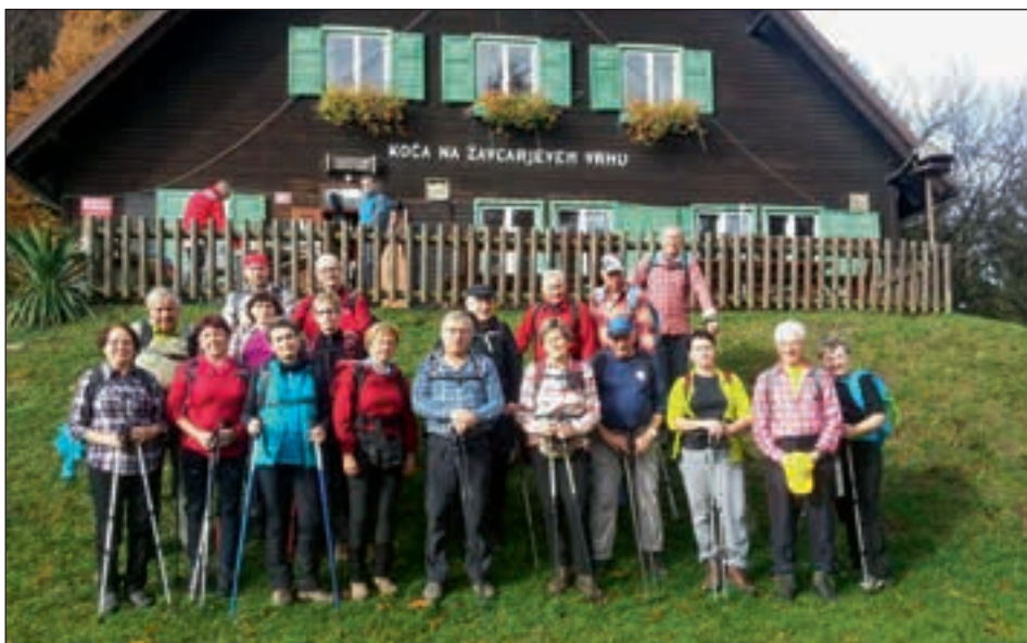
Hajdinski planinci na Žavcarjevem vrhu