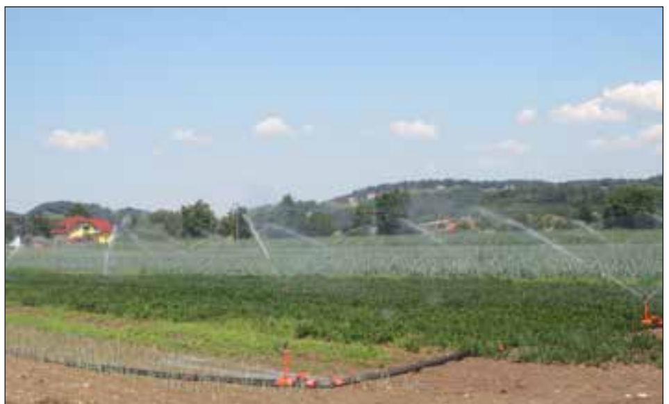
Namakanje solate, zelene in pora na velikem namakalnem sistemu Formin

Pogosto se po kratkotrajnem premoru med dvema sušnim obdobjema mnogi srečajo tudi s koreninami na gomoljih krompirja. Te so spet posledica suše, ko so rastline zaključile rast, nekaj padavin in nižje temperature pa so povzročile novo rast in gomolji so pognali nove korenine. Tudi tak krompir izgublja kakovost. V zadnjih treh letih se prav pri krompirju srečujemo še z enim pojavom, steklavostjo gomoljev. Krompir kuhamo in kuhamo, pa ostaja trd. Ta pojav je tipičen za nepravilno, neenakomerno preskrbo z vodo, ko krompirja ne namakamo, tudi letos se pojavlja predvsem pri poznih sortah krompirja. V letošnjem letu mnogi tarnajo tudi zaradi gnilih, preperelih obročev na prerezu čebule. Tudi ti so posledica tega, da je bilo