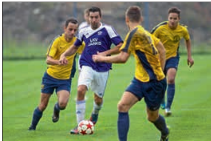
Nogometaši Gerečje vasi (vijoličasti dres) so jesenski del prvenstva Superlige MNZ Ptuj končali na prvem, Hajdinčani pa na 6. mestu.