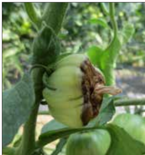
Gnitje plodov paradižnika, posledica nepravilne preskrbe z vodo

aprila in tudi maja v posameznih obdobjih presuho, rastlinam je v času debeljenja čebule zmanjkalo vode, s tem pa kalcija. Tam najdemo zdaj te obroče. Tudi čebulo in česen je torej treba namakati.