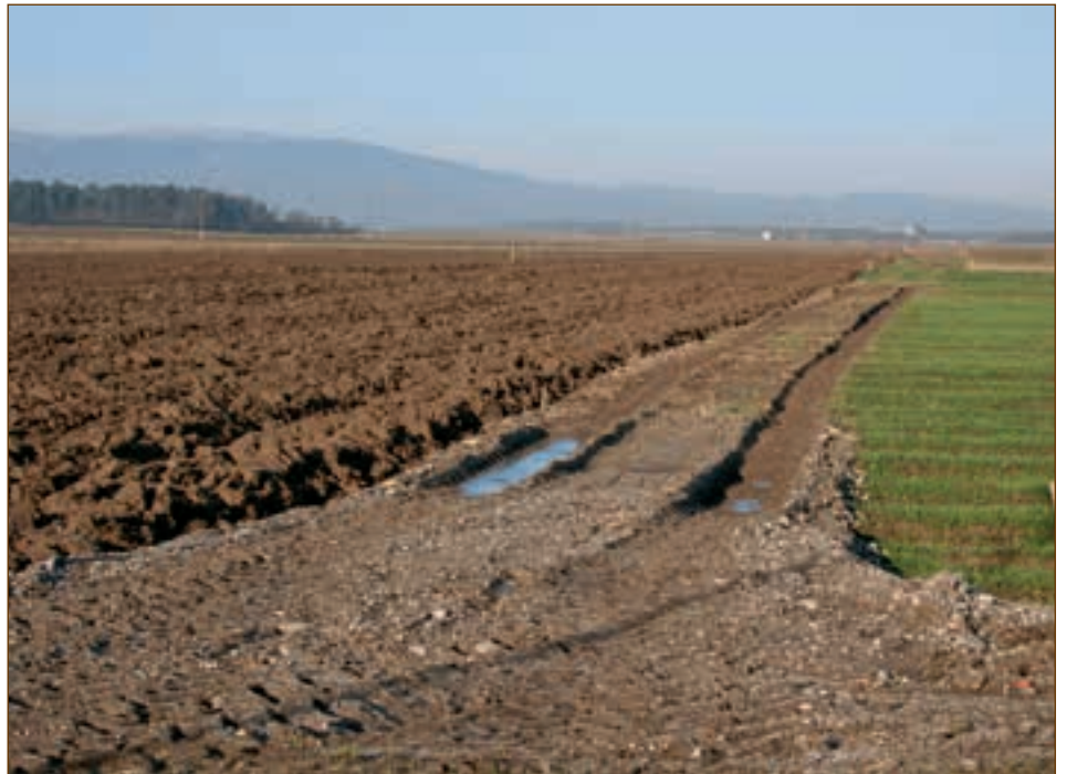
Projekt komasacije na komasacijskem območju Hajdina 1 je sredi decembra v zaključni fazi.

na Hajdini zelo velike možnosti, da uspemo na javnem razpisu za pridobitev državnih in evropskih sredstev za namakalne sisteme. Naše komasacije so vzorčen primer, kako se je treba aktivnosti lotiti in jih uspešno