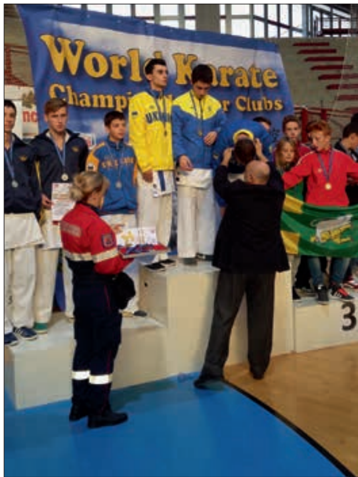
Mlada ekipa Hajdine je v ekipnem tekmovanju kadetov od 14. do 17. leta zasedla odlično 3. mesto.