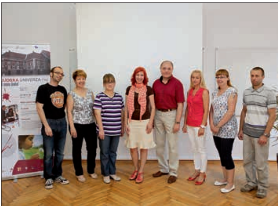
Ekipa Ljudske univerze Ptuj je pripravljena na nove izobraževalne programe.

Na Ljudski univerzi Ptuj se trudimo, da prebivalcem Ptuja in okolice ponujamo množico različnih izobraževalnih programov, s katerimi želimo ostati v koraku s časom, ki narekuje (tudi) na področju izobraževanja izreden tempo.