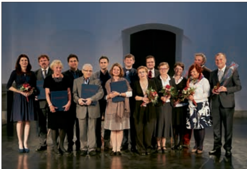
Sodelavci v projektu Gratae posteritati in častni gostje prireditve na odru dominikanskega samostana