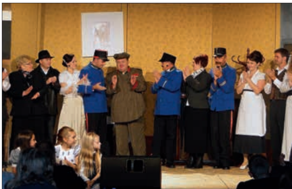
Ker so igralci na odru uživali in igrali s srcem in dušo, smo uživali tudi mi, ki smo jih gledali.

»V bistvu smo bili prvič skupaj šele eno vajo pred generalko, na generalki pa smo prvič videli sceno in dobili mikrofone. Ti mikrofoni so zelo dobra zadeva, predvsem zaradi glasilk, drugače pa mi je bil mikrofoni tudi ovira pri gibanju, ker sem imel zelo razgiban lik in sem si moral mikrofoni kar naprej popravljati. Bilo nas je res veliko igralcev in prav vsi smo se zelo dobro razumeli, to je tudi pogoj za dobro predstavo. Uspeh za dobro predstavo pa je tudi to, da smo glavne vloge igrali izkušeni igralci, igralci s kilometrinom.«