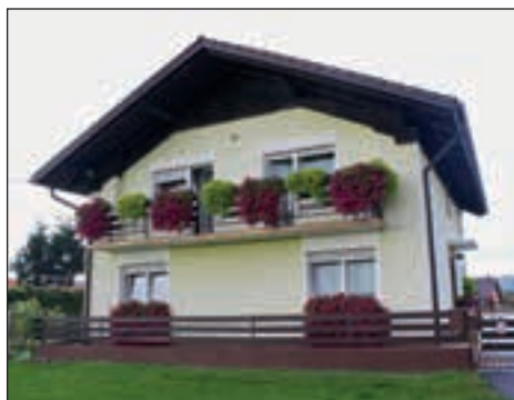
V kategoriji vzorno urejena kmetija je komisija priznanje dodelila kmetiji Mlakar - Kolarič iz Slovenje vasi.