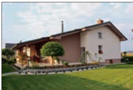
Srebrno vrtnico je prejel dom družine Petek iz Gerečje vasi.