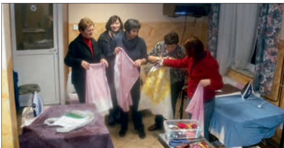
Utrinek iz „likalnice“

Tokrat so za barvanje uporabile zelenjavo, sadje, čaje in začimbe, da so dobile sedem barvnih odtenkov, vse od rumene, oranžne, olivne, rjave, bledovijoličaste do temno vijoličaste. Tokratne količine tekstilij so kuhale kar v velikih loncih, obarvane tekstilije pa bodo na koncu dobile tudi svojo obliko in namen.