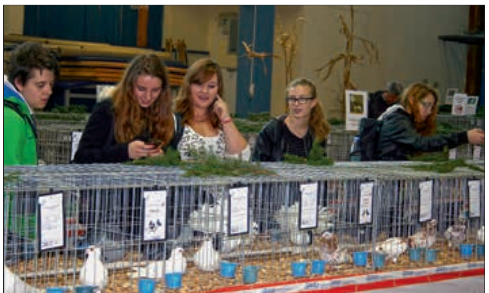
Mladi obiskovalci so se posebej radi ustavili pri pisanih golobih.