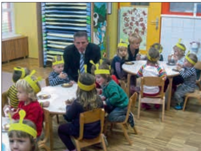
Pridne čebelice okušajo tradicionalni slovenski zajtrk.