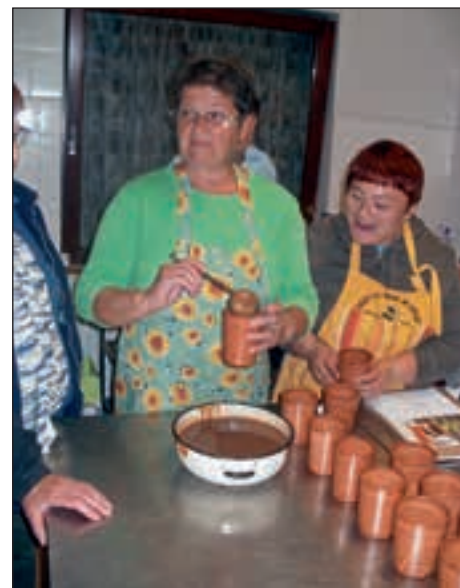
Pri pripravi sestavin so zavzeto pomagale domače članice.

Ker je sladica sestavljena iz več različnih sestavin, vsaka se tudi pripravlja na svoj način, je sicer priprava take sladice sorazmerno dolgotrajna v pri-