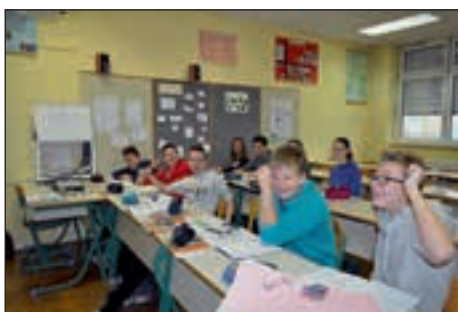
Na novo prepleškana učilnica

Na OŠ Hajdina s PE Vrtec verjame, da bomo lahko tudi v prihodnje