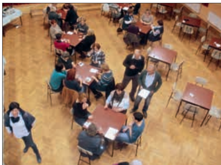
Komisija je budno spremljala potek iger tudi med samim turnirjem.

Proti koncu turnirja je rahlo začela naraščati tudi temperatura v tekmovalnem delu, saj so tri finalne igre odigrali