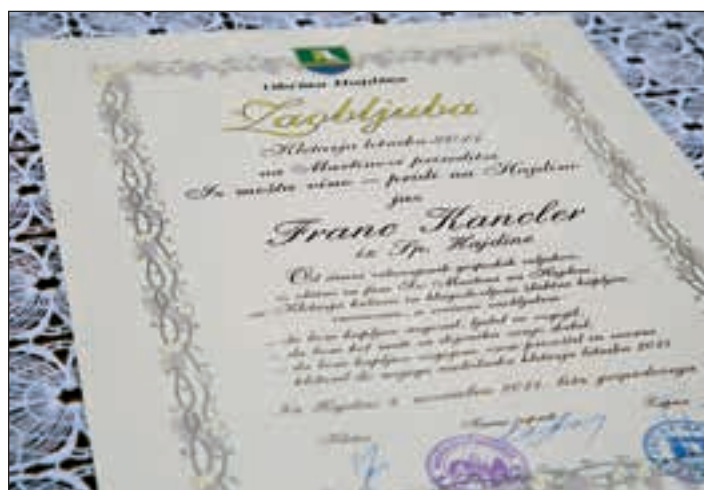
Novi kletar bo svojo funkcijo opravljal odgovorno in častno. Tako je obljubil ...