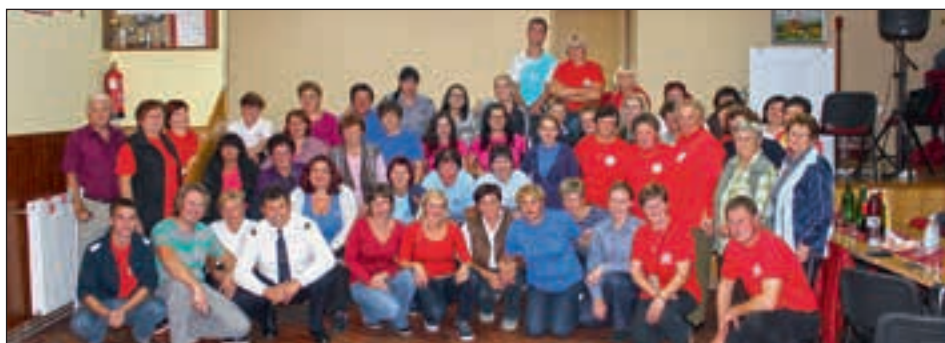
Na srečanje članic v PGD Kicar ostajajo lepi spomini.

Na srečanju so sodelovale gasilke iz PGD Hajdina, Draženci, Podvinci, Ptuj, Grajena, Sp. Velovlek, Gerečja vas, Nova vas pri Markovcih, Zabovci, Mar-