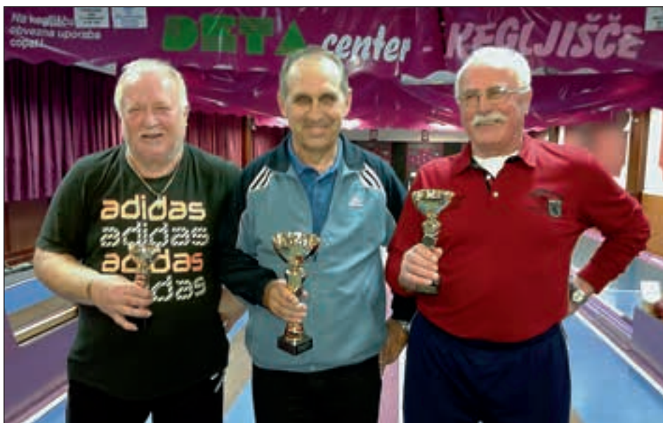
Občinski praznik 2014 – najboljši trije v kegljanju