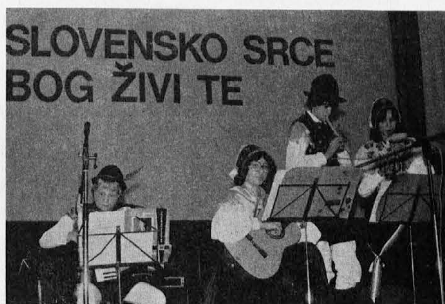
Nastop ansambla slovenske sobotne šole v Sindelfingenu pri Stuttgartu na binškošnem srečanju Slovencev 6. junija letos