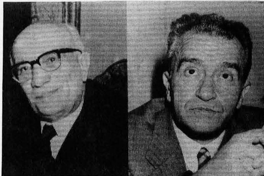
Pietro Ingrao, komunist (na desni) je bil izvoljen za novega predsednika poslanske zbornice, Amintore Fanfani, demokrstan (na levi) pa za predsednika senata

Bo Jugoslavija kos tej nalogi? Bo to hotela? Njena odgovornost je velika in želeli bi, da ne bi razočarala zamejskih Slovencev.