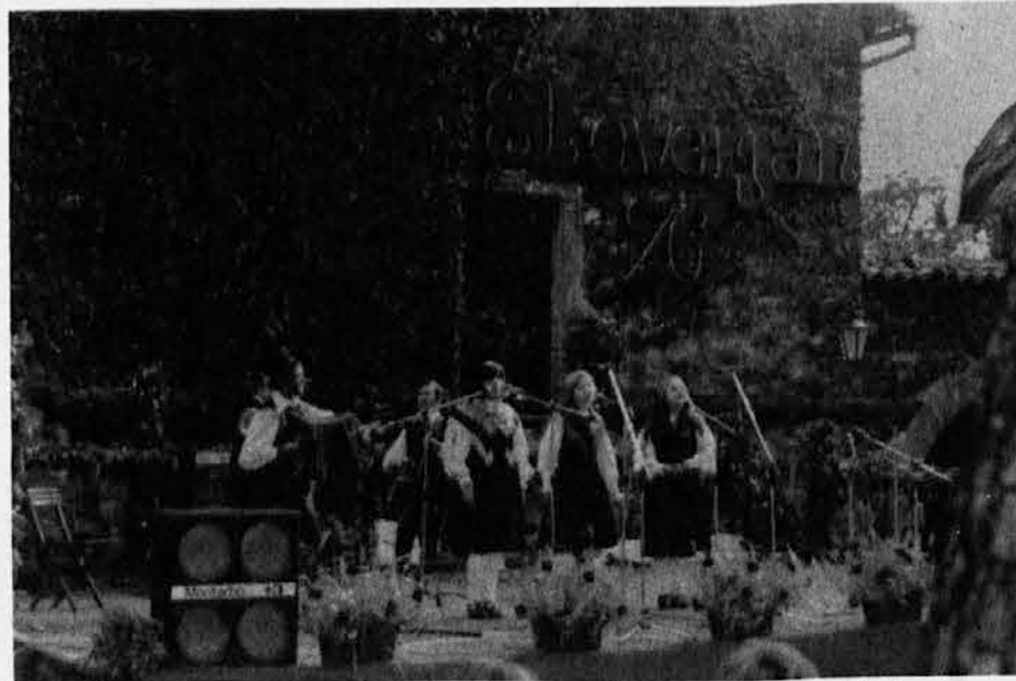
Trio Atelšek iz Ljubljane je prejel pokal pokrajinske uprave za turizem

Dobra organizacija prireditve je bila za vse prisotne prijetno presenečenje, za prireditelje pa uspeh festivala močna vzpodbuda, da bodo v prihodnjih letih s festivalom nadaljevali. Vsem, ki so pomagali pri izvedbi prireditve, gre zahvala in priznanje, vse pa, ki so na prireditve prišli, pa vabimo, da se je prihodnje leto udeležijo v vsaj takem številu kot letos.