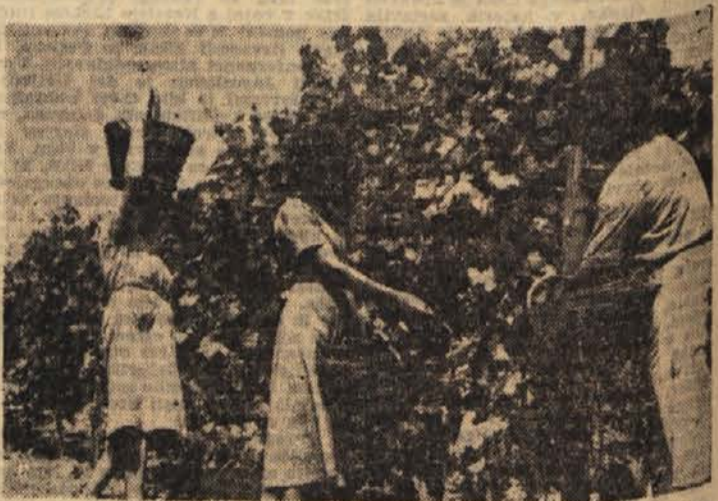
V pričakovanju vesele trgatve: letos bo vinska kapljica slajša kot lani, saj ni dvoma, da bo vztrajno jesensko sonce obogatilo grozdje s sladkorjem