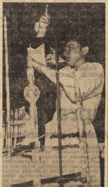
V kemijskem laboratoriju inštituta »Boris Kidrič« v Vinčici

Nuklearna izžarevanja uničujejo tudi različne škodljivce v skladiščih in na rastlinah. Veliko poizkusov v laboratoriju in pri-