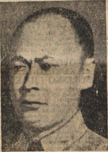
Cen Ji Izjemno stanje v Rodeziji

Praksa bo pokazala, kako je naj-bolje, da ta organ organizira svoje delo. Važno je samo, da je tesno po-vezan z vsem kolektivom, da upošteva in hitro sprejema vse, kar se novega in koristnega pojavlja v tej ali oni pa-nogi industrije. Zelo važno je tudi, da se kolektiv seznanja z vsemi posli ta-kega organa. Njegovo poslovanje bi lahko redno obravnavali na delavskih konferencah in proizvodnih sestankih. Skratka, ves slog dela tega organa mora biti takšen, da bo krepil med-delavec in strokovnjaki čut odgovor-nosti za podjetje in krepil njihovo poudbo.