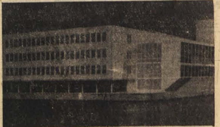
Zahodnonemški parlament v Bonnu

delegacija je bila lani v maju na obisku v Jugoslaviji.