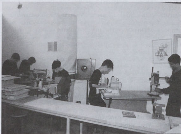
Ustvarjalni šestošolci pri tehniki