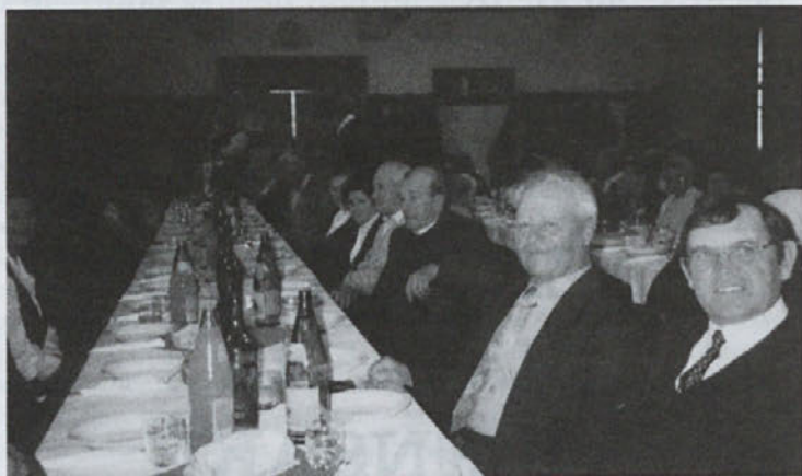
Upokojenci so silvestrovali

Društvo upokojencev Dornava je med večjimi društvi v naši občini, saj imamo sedaj 288 članov. Kljub letom in raznim starostnim tegobam pa ne mirujemo. Delamo po obsežnem letnem