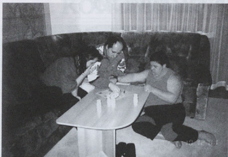
Stanovanje Rimska ploščad 18, Ptuj

26. aprila smo uradno in svečano odprli stanovanjske skupine v Ptuj, kamor smo