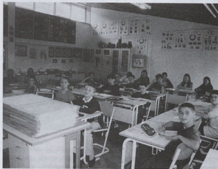
Petošolci v likovni učilnici