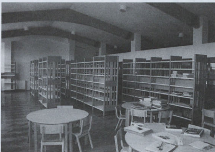
Knjižnica že dobiva svojo podobo

Zdenka Kostanjevec, ravnateljica OŠ