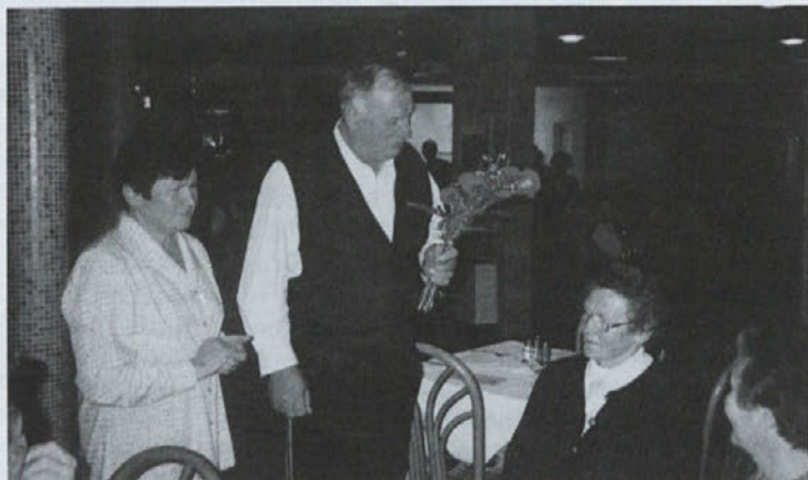
Čuševa mama je praznovala okrogli jubilej v Izoli