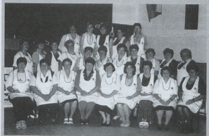
Članice društva kmečkih žena občine Dornava

V zadnji številki Glasila Občine Dornava, decembra 2001, nam je na strani 11 zagodel tiskarski škrat. Tako se je pod fotografijo članic Društva kmečkih žena občine Dornava znašel napačni podpis. Za napako se opravičujemo.