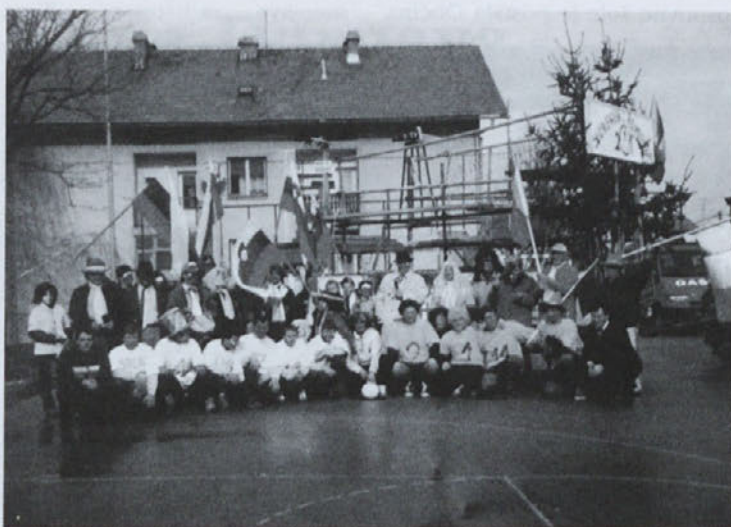
Člani nastopajoče ekipe na pustnih prireditvah leta 2002 »Slovenija gre naprej«