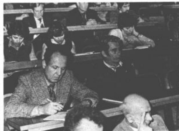
Te dni so se začele v Saleški dolini razprave o planskih dokumentih za leto 1982. V torek so se o tem posvetovali predstavniki delovnih organizacij.