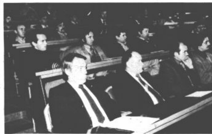
Tudi komunisti tozda Jamska mehanizacija bodo dosledno uresničevali zaupane jim naloge

Največ pozornosti bodo v prihodnje posvečali delegatskemu delovanju. Kar najbolj skrbno bodo pripravljali gradivo, ki ga bodo na skupščinah obravnavali delegati in upajo, da bodo s tem prispevali, da bo delegatsko odločanje uspešnejše. M. Zakošek