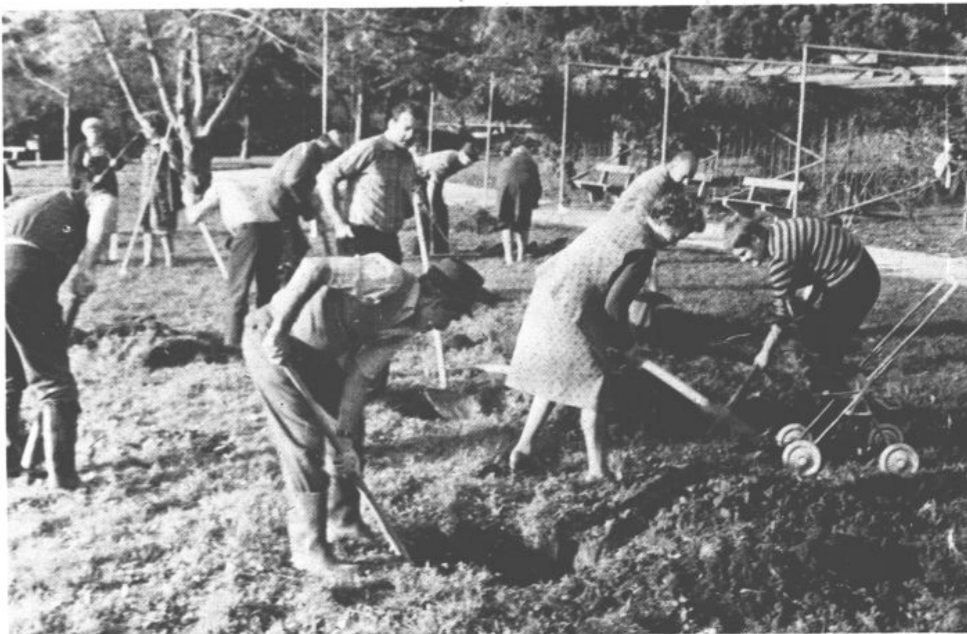
Krajani Stare vasi so se prejšnji četrtek v velikem številu zbrali v mestnem parku, da bi zasadili 88 dreves v spomin na tovariša Tita. Organizatorji so bili nad udeležbo presenečeni,

saj skorajda ni bilo gospodinjstva, ki ne bi imelo na prostovoljni delovni akciji predstavnika.