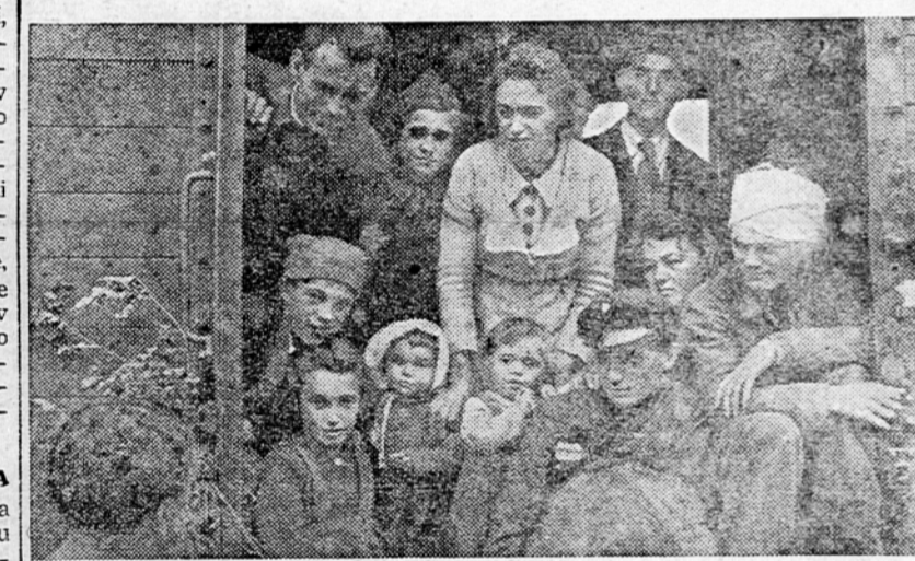
Skupina povratnikov v razgovoru z občinstvom na gorenjskem kolodvoru

Včeraj dopoldne je spet prisopihal vlak na gorenjski kolodvor in vrnil domovini pred štirimi leti s silo izseljene sinove in hčere, 466 Slovencev in 360 Hrvatov in Srbov.