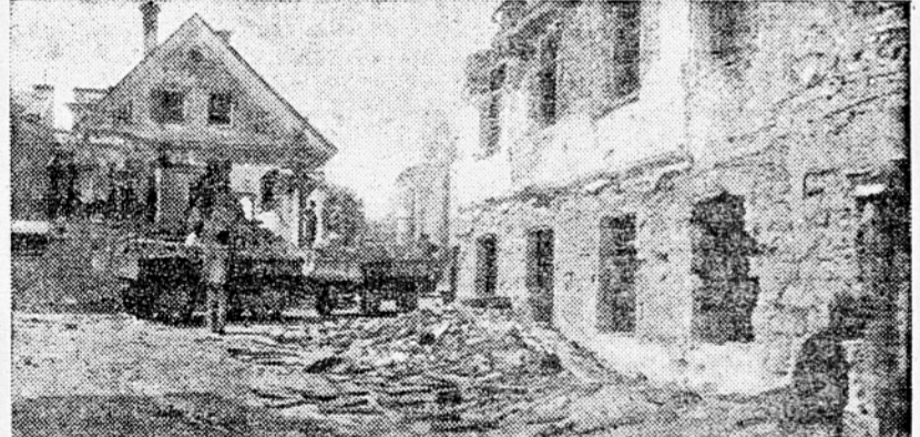
Pogled na porušena poslopja v Novem mestu, kjer odstranjujejo ruševine

Ekipe mladincev in borcev XX. divizije so nabrale že ogromne količine teh razbitih ostankov, iz katerih bodo napravljeni mostovi, proge, traktorji in še mnogo drugega, koristnega. Z nekega hriba blizu kraja Št. Vid v Vipavski dolini je mladina z borci XX. divizije nosila 10 km daleč dele porušene aviona. V Divači je mladina z borci iste divizije z zastavami odšla na delo in nabrala okrog 50 ton železa. In tako je šlo dele od rok povsod: v Kozini, Bistrici, Postojni, Ajdovščini in po vseh drugih manjših in večjih krajih. V zgodnjih jutranjih urah pred začetkom dela na polju, v času izven vojaške službe, v večernih urah — vsak si je našel čas, ko je poleg svojega posla delal še za domovino. In v tem plemenitem delu so tekmovali borci in prebivalstvo enega okraja z borci in prebivalstvom drugega okraja. Uspeh je pokazal 75 vagonov železa ter okrog 3 tone aluminija. Požrtvovalen mladinec je predlagal, da se vlak, ki bo peljal to železo v topilnico, okraši z napisom: »Svoji domovini, demokratični federativni, Titovi Jugoslaviji — ljudstvo in borci iz slovenskega Primorja.«