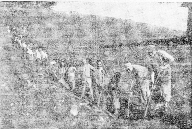
Delo na vodovodu pri Novem mestu: tudi civilno prebivalstvo pridno pomaga

Dopisniki iz vse Slovenije nam poročajo o uspehih dela za obnovo domovine