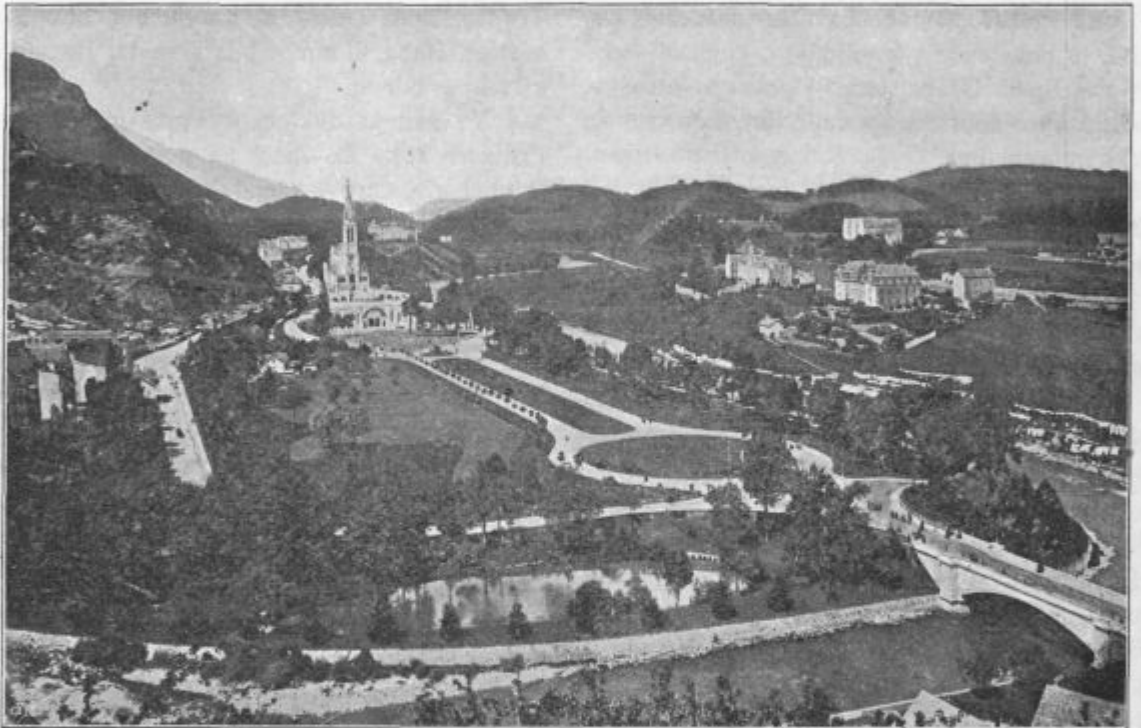
Lurd; pred cerkvijo.

Bila je obletnica dne, ko je angel Gabrijel prišel k najčistejši Devici v Nazaret in jo pozdravil v Gospodovem imenu: Cerkev je obhajala spomin Marijinega oznanenja.