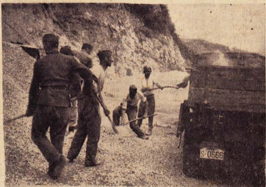
V akciji sodeluje veliko število pripadnikov Jugoslovanske armade

Se imamo lepe jesenske dneve. Ni še vse zamujeno, še je čas, da povečamo zaloge živinske krme.