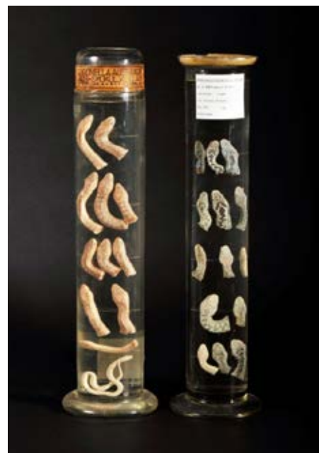
V alkoholu preparirane glave kač, ubitih med velikim uničenjem strupenjač na Kranjskem. V levem kozarcu je 11 glav smokulje ( Coronella austriaca ), ki so jo ljudje pogosto zamenjevali z gadom, v desnem kozarcu pa je 14 glav navadnega gada ( Vipera berus ).

V herpetološki zbirki Prirodoslovnega muzeja Slovenije hranimo tri kozarce s preparati kačjih glav, ki jih je prepustil Deželni odbor. *