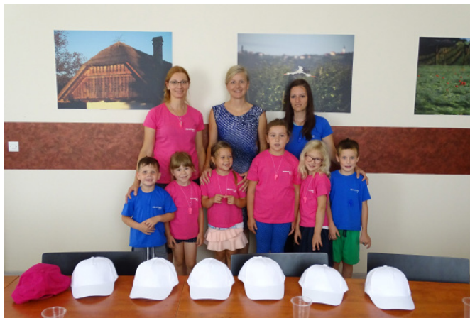
Minimaturanti z vzgojiteljicama obiskali občino