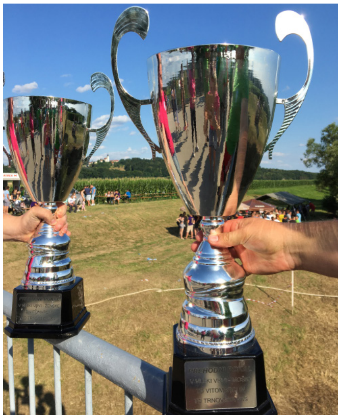
Prehodna pokala tudi letos v Vitomarce

Letos je bila priprava ekip na vrhunskem nivoju. Vse ekipe so imele več treningov. Zdi se, da so v številu treningov in sami pripravljenosti prednjačili občani iz Trnovske vasi, a je boginja Fortuna letos še bila na strani Andrašovčarjev. Oprema članov ekipe, motivacija, duševna ter fizična pripravljenost vseh je bila res na nivoju državnega prvenstva.