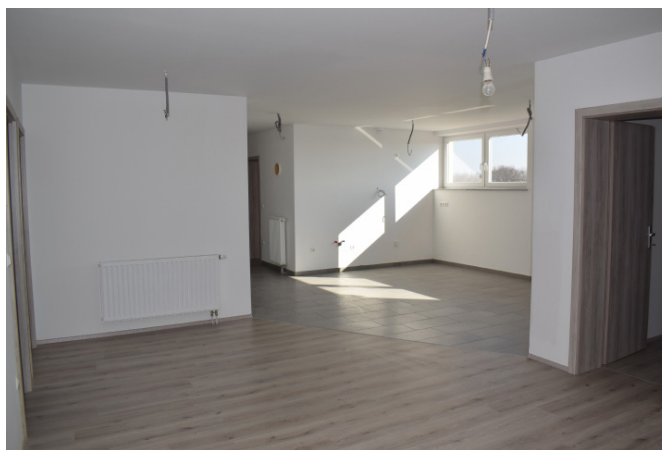
Prodani obe stanovanji nad Večnamesko dvorano