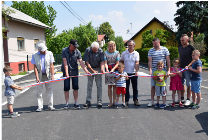
Otvoritev urejenega centra Vitomarc

Predmet projekta je bila rekonstrukcija cevovoda v dolžini cca. 180 metrov, vključno z izvedbo 14 prevezav na nov vodovodni sistem. Zgrajeno je bilo kanalizacijsko omrežje v dolžini cca. 180 metrov. Na območju je bila narejena tudi javna razsvetljava, in sicer 7 kandelabrov z varčno LED razsvetlavo. Zgrajen je bil pločnik v dolžini cca. 70 metrov. Položen je bil cevovod za novo električno omrežje. Vrednost investicije je znašala 120.097,00 EUR. Na podlagi 21. člena Zakona o financiranju občin (ZFO) bomo prejeli 25.610,00 EUR.