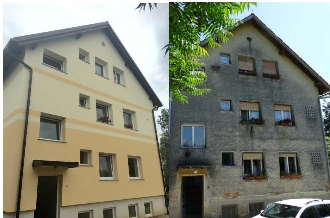
Stanovanjski blok po in pred energetska obnova

V letih 2015-2018 smo za sofinanciranje malih čistilnih naprav namenili 11.710,00 EUR.