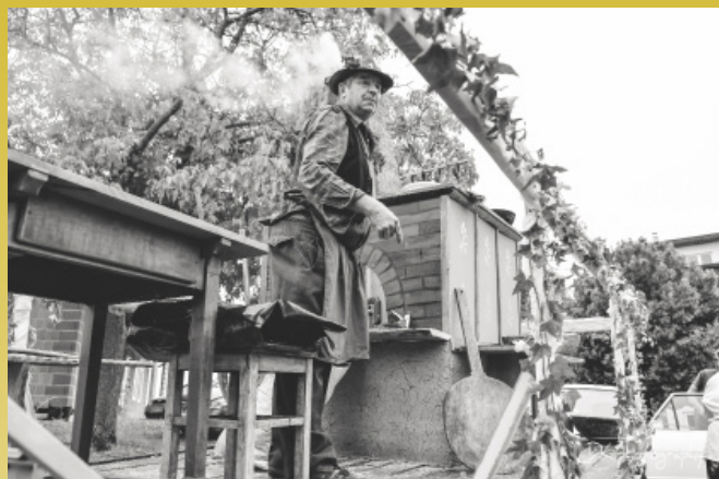
Nedeljska povorka oldtimerjev in tradicionalnih ljudskih običajev