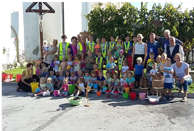
Berači iz vrtca Vitomarci