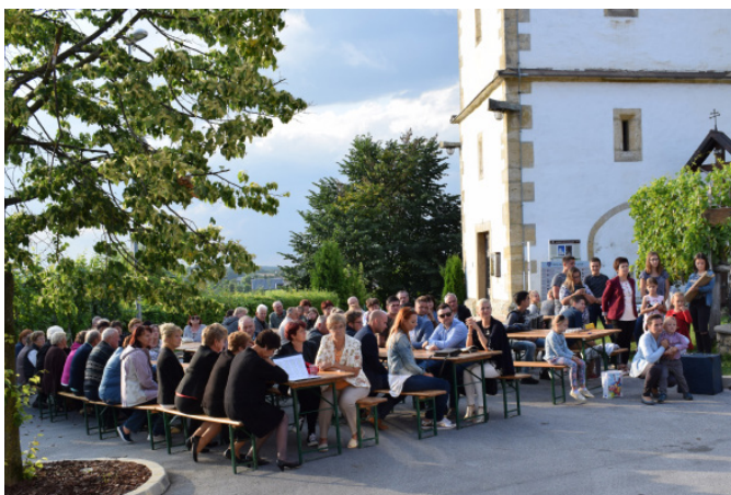
Proslava ob dnevu državnosti