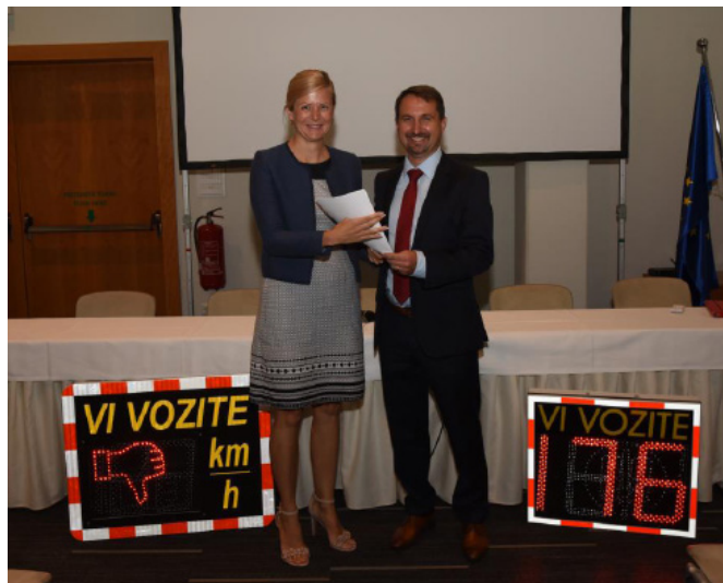
Občina prejela drugi prikazovalnik hitrosti

Občina Sveti Andraž v Slovenskih goricah je bila uspešna na javnem razpisu Agencije za varnost prometa in v brezplačni desetmesečni najem prejela prikazovalnik hitrosti »Vi vozite«.