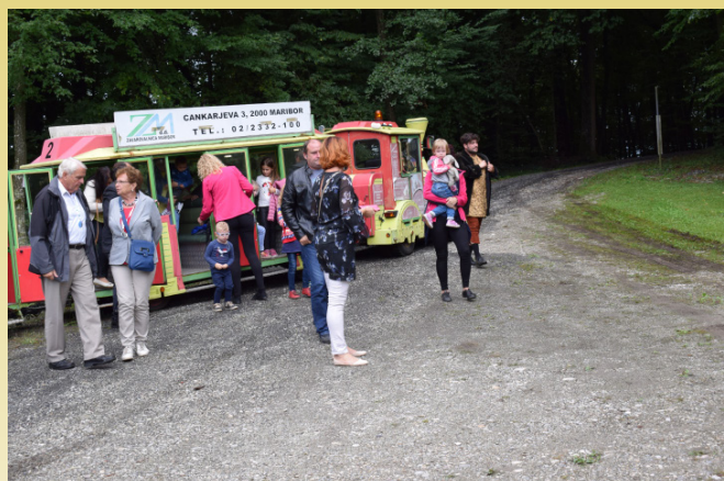
Turistično vodenje s turističnim vlakcem