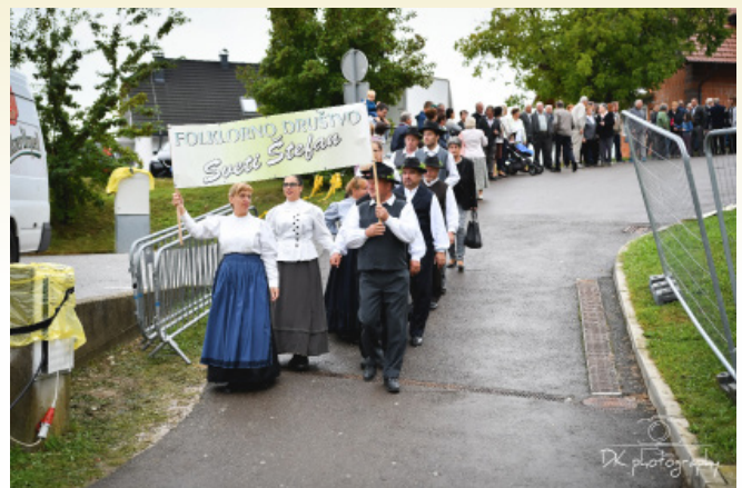
Povorka domačih društev, vaškega odbora in povabljenih skupin