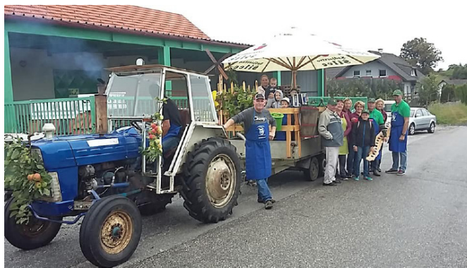
Pripravljene na povorko

Prispelo je veliko pozitivnih kritik, priznanj in pohval za delo ki ga je naše društvo vložilo v pripravo na povorko.