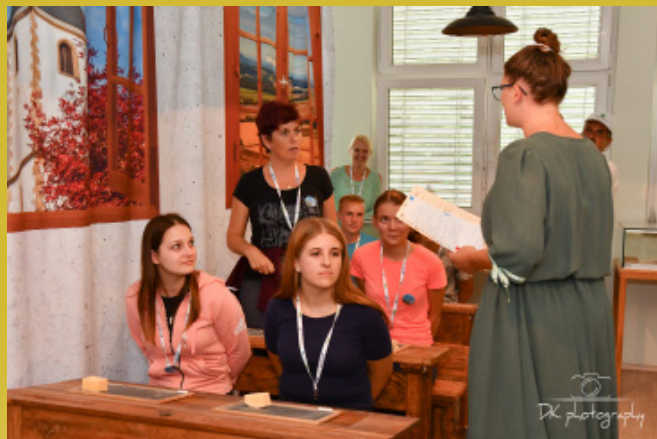
Učne ure v muzejski učilnici, kot so bile 100 let nazaj