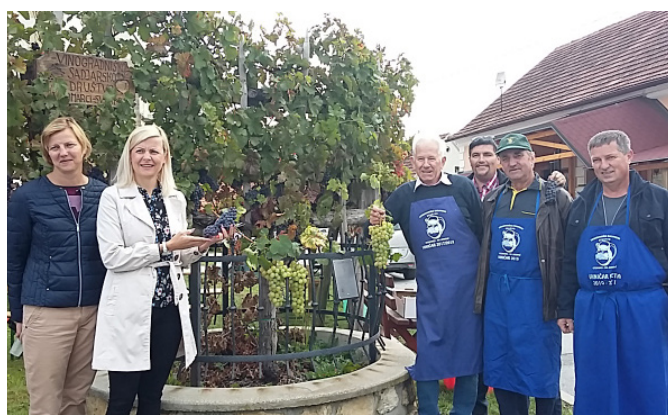
Trgatev potomke najstarejše trte

Ob lepem vremenu je potekalo prijetno druženje ob odličnem srninem bograču, pecivu, dobrem vinu in oblici dobre volje.