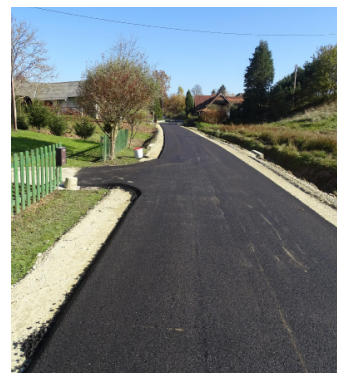
Nova asfaltna cesta

V projektu je bila izvedena modernizacija vozišča obstoječe asfaltne ceste skozi naselje Vitomarci v dolžini 965 metrov in širine 2,60 – 3,00 metra. Vrednost investicije je znašala 56.882,46 EUR. Na podlagi 21. člena Zakona o financiranju občin smo prejeli 19.309,00 EUR.