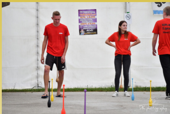
Igre brez meja 2018