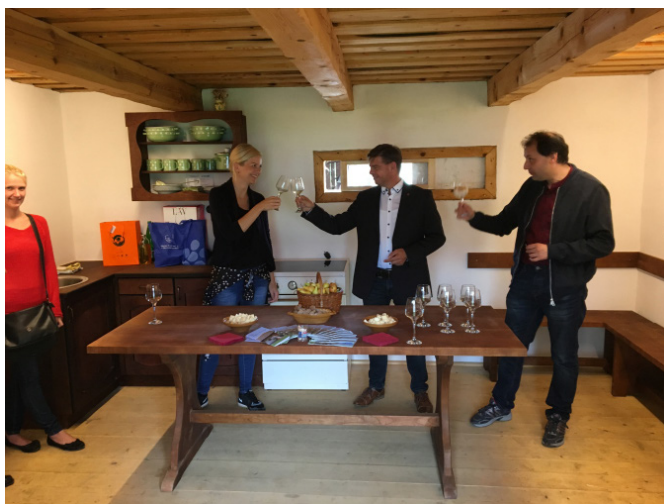
V Hrgovi domačiji

Če je naša občinska uprava v lanskem letu obiskala Sveto Trojico, smo občinsko upravo Svete Trojice tokrat v goste povabili mi. Priredili smo prijetno popoldansko srečanje, ki smo ga začeli pri Hrgovi domačiji, nadaljevali s šolo lepega vedenja v naši novi učilnici šolstva skozi čas in se na koncu odpravili na prijateljsko nogometno tekmo v športni park Drbetinci. Sreča je bila tokrat za las na naši strani, čeprav so bili naši sosede odlični.