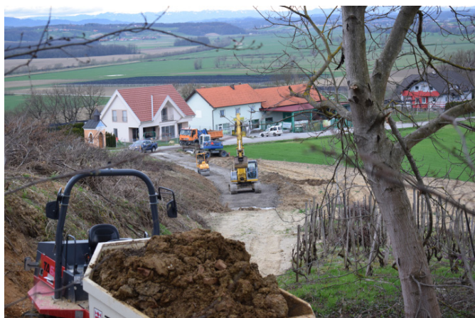
Gradnja Poti strpnosti