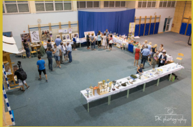
Otvoritev razstave društev in tržnice lokalnih ponudnikov