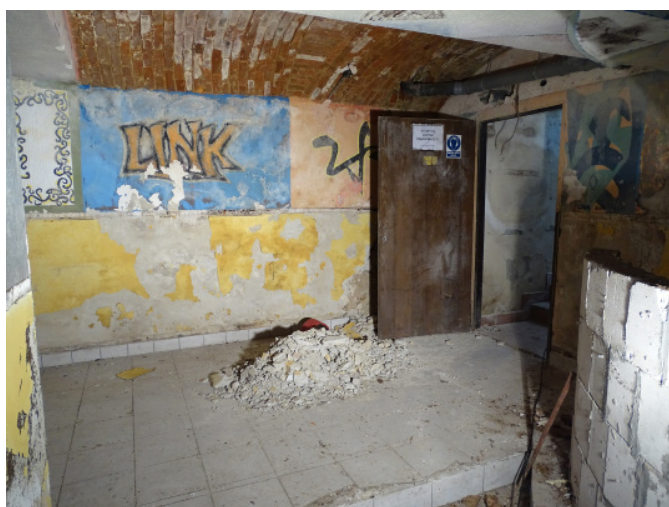
Stanje kletnih prostorov občinske stavbe

Prva faza projekta obsega izvedbo investicijskih del za sanacijo prostora z vključenimi gradbenimi deli, elektro instalacijami in ogrevanjem, slikopleskarskimi deli, keramičarskimi deli ter montažo stavbnega pohištva. Nosilec stroška je Občina Sv. Andraž v Slov. goricah.