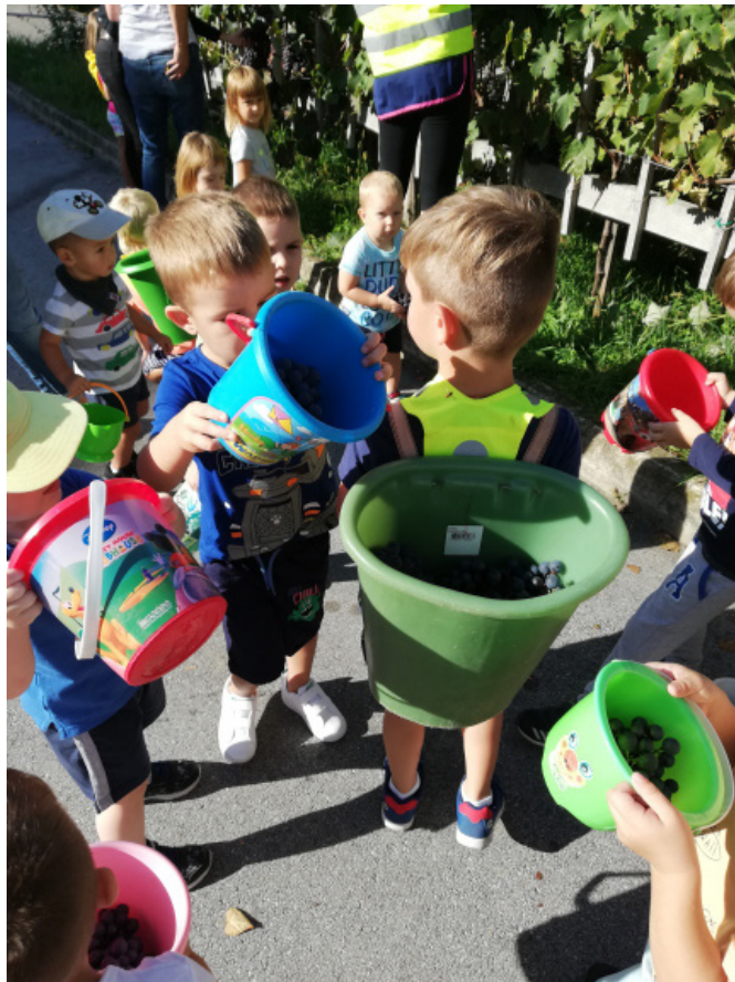
Berači in pütarji