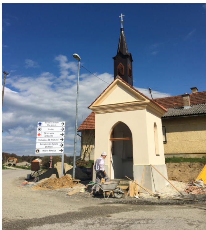
Obnova Antonekove kapele

Izvedla se je popolna obnova dveh kapel in enega kužnega znamenja. Strošek obnov: Pavličeva kapela 5.936,00 EUR, Antonekova kapela 10.408,00 EUR. Strošek obnove znamenja na Selah: 4.600,00 EUR.