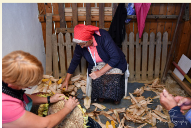
Prikaz tradicionalnih šeg in navad