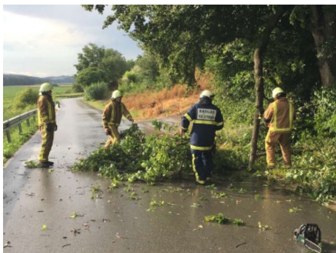
Z novo avtocisterno bo na intervencijah precej lažje in hitreje

V letih od 2015 do september 2018 smo za sofinanciranje programov društev namenili 70.055,32 eur.