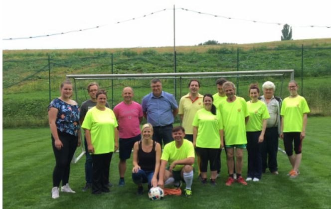
Občinski upravi pomerili moči na igrišču