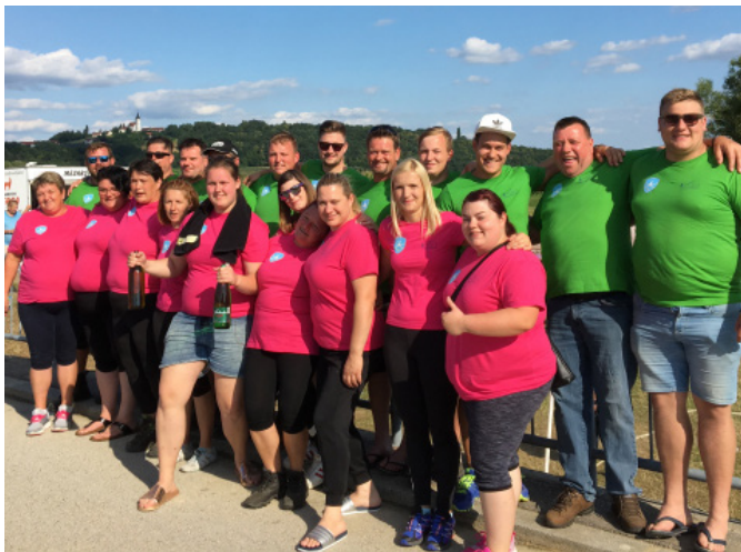
Člani naših ekip, brez katerih nam vleka vrv ne bi bila tako zanimiva

vleke vrv so Andrašovčarji postavili stvari na svoja mesta. Potrebno je bilo nekaj motivacijskih besed, tehničnih napotkov ter okrepčila in že so naši vrv potegnili kot treba. Rezultat je bil 1:1 pri ekipah obeh spolov. Sledil je žreb, na kateri strani reke Pesnice bodo ekipe vlekli. Sreča je bila v obeh primerih naklonjena našim tekmovalcem, saj smo vlekli na strani Trnovske vasi, katera bi naj bila terensko lažja. Nismo se obremenjevali s tem dejstvom. Treba je bilo še zadnjič z vso močjo potegniti vrv in zmagati. Obe našima ekipama je to seveda uspelo in že drugo leto zapored se veselimo zmage in prehodnih pokalov.