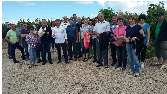
Pred vinarijo Masvin

Po vožnji preko Hrvaške do Šibenika smo v dopoldanskih urah prispeli do Benkovca. Tam smo si ogledali vinarijo Masvin. Ukvarjajo se s pridelavo vina in oljčnega olja. Lastnik vinarije, nekdanji vojak, nam je na zanimiv način predstavil svoje posestvo. Degustirali smo tudi njihove odlične proizvode.