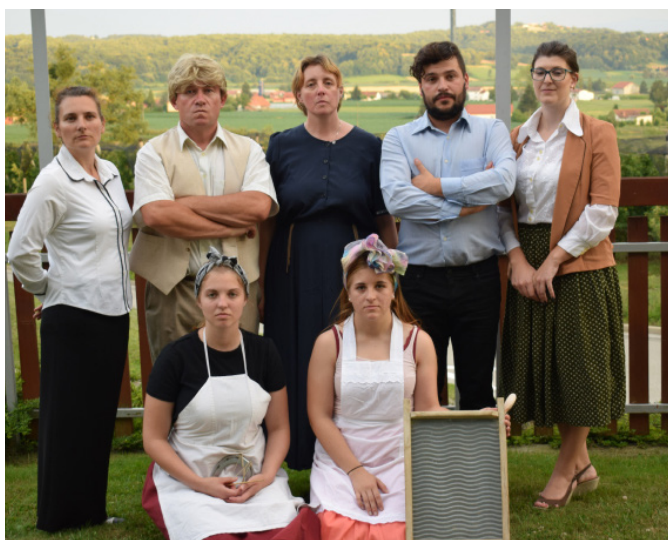
Izvajalci programov v učilnici

V okviru projekta smo kot pilotno izvedbo turističnega produkta osnovnošolskim otrokom predstavili pouk kot so ga doživljali naši babice in dedki. Udeležili so se ure discipline, olike in lepega vedenja, kjer so spoznali sankcije učiteljev nekoč – klečanje na koruzi ali na oslu, aktivno sodelovali pri uri lepopisja in računstva in se učili starih ljudskih pesmi. Na drugem delu delavnic so skozi zanimive uganke, namige ter orientacijo v prostoru, po poti strpnosti spoznavali legende in zanimivosti območja ter se učili o kulturni dediščini.