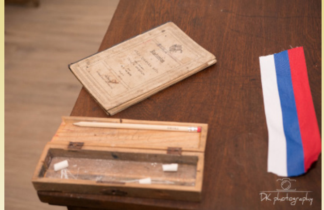
Otvoritev muzejske učilnice