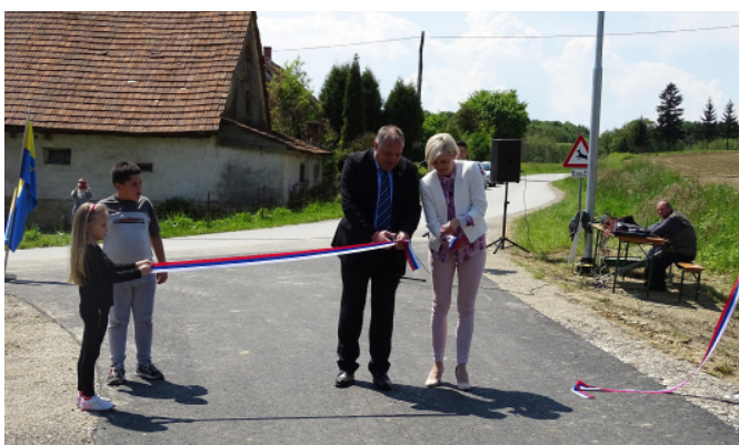
Otvoritev ceste Brezovjak-Župetinci-Novinci

Urejeno je bilo vozišče v širini 3 metrov in skupni dolžini 1.090 metrov. Vrednost investicije je znašala za leto 2015 - 20.993,98 EUR, leto 2016 - 53.401 EUR, skupno Na podlagi 21. člena Zakona o financiranju občin (ZFO) smo prejeli 28.873 EUR.