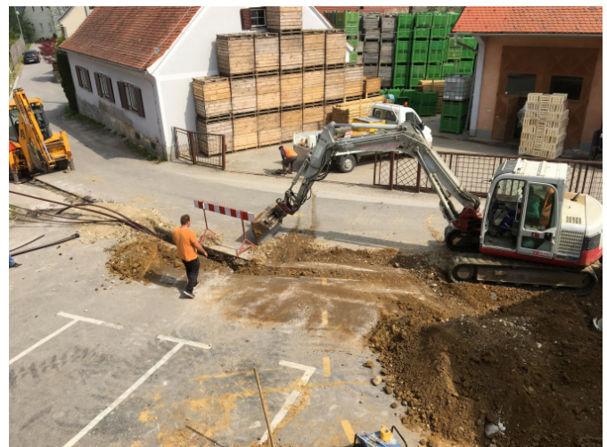
Dela na optičnem omrežju

V našo občino smo v dogovoru s podjetjem Telekom d.d. pripeljali optično omrežje, ki omogoča hiter internet. V interesu Telekomu so se tržno pokrile tri vasi. Vrednost zasebne investicije je znašala cca. 400.000,00 EUR. Ker za ostale vasi ne obstaja tržni interes smo se že v letu 2015 priključili k evropskemu projektu RUNE, ki bo zgradil optično omrežje po celotni občini, trenutno je v zaključku faza projektiranja. Ocenjena vrednost investicije znaša cca. 2.000,00 eur po posameznem priključku in je v celoti financirana.