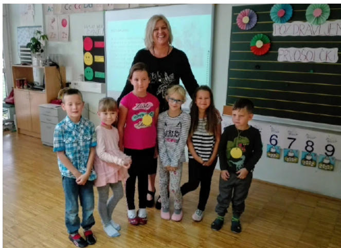
Prvošolčki z učiteljico

prejeli majhno darilce učiteljice. V košari balončka sta jih pričakala levček in tiger ter pismo, ki so ga smeli odviti in prebrati skupaj s starši šele zvečer.