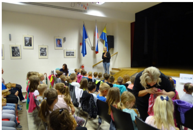
Otroci si ogledali film