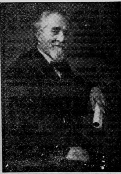
violinu tudi odlično absolvirat kot učenec violinista Helmesbergerja, Stranske predmete je študiral pri skladateljih Antonu Brucknerju in Robertu Fuchsju; poslednji je bil tudi učitelj našega skladatelja Antona Lajovca. Takoj po absolutoriju je bil nastavljen