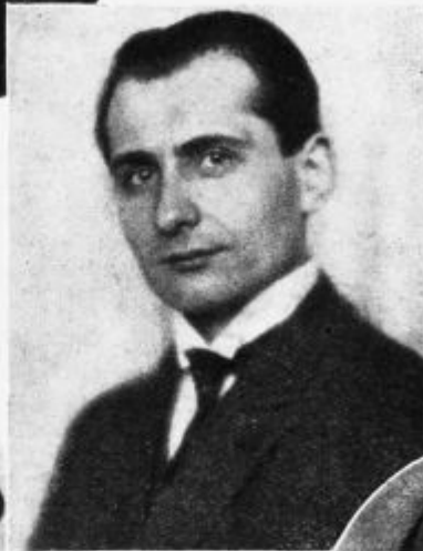
(Slike iz arhiva »Radio-Journal-a v Pragi)