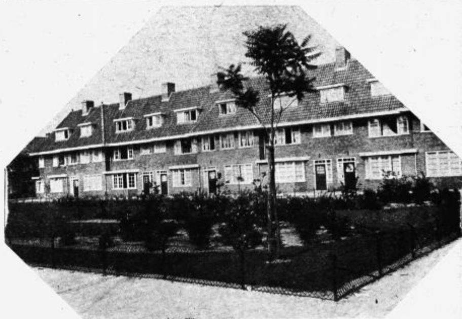
Uradniške stanovanjske hiše Philipsovih tovarn v Eindhovenu.

Pregledna tabela kot priloga v tej številki!