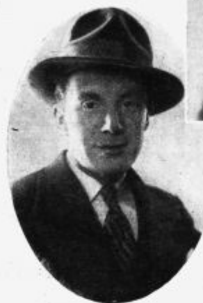
K ponedeljkovemu srednjeevropskemu simultnemu večeru iz Prage.