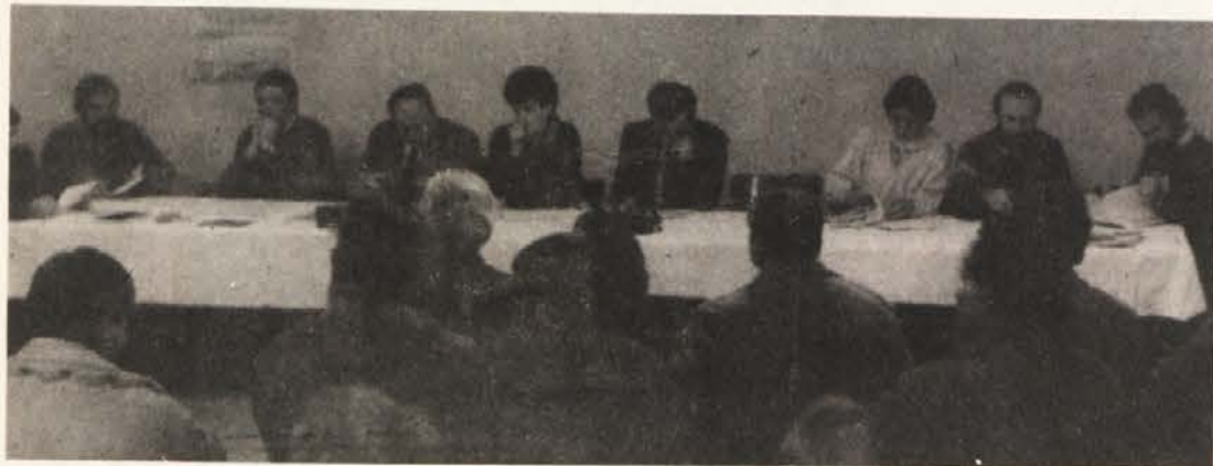
Pri diskusiji so sodelovali režiser, dramaturg, igralci in ocenjevalci Miklove Zale '87.

V nečem so si bili vsi diskutanti edini; Miklova Zala '87 je bila potrebna in je potrebna tudi sedaj v odločilnih trenutkih, ko drugi odločajo o naši usodi. Le če bomo znali razpravljati tudi o takšnih vprašanjih kot je npr. takšna uprizoritev, bomo zmožni skupaj razpravljati in iskati odgovore na vprašanja, ki so eksistenčnega pomena za narodno skupnost.