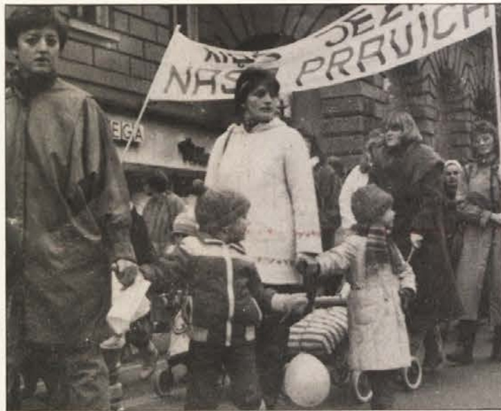
Matere z otroki so vzele nase vse muke, namesto razumevanja pa so jih mimoidoči samo psovali.

Če nam bodo očitali trmoglavost, ekstremizem in nekompromisnost, jih bomo ponosno zavrnil: „Nikarte! – Ta burka je stara že tisoč let!“