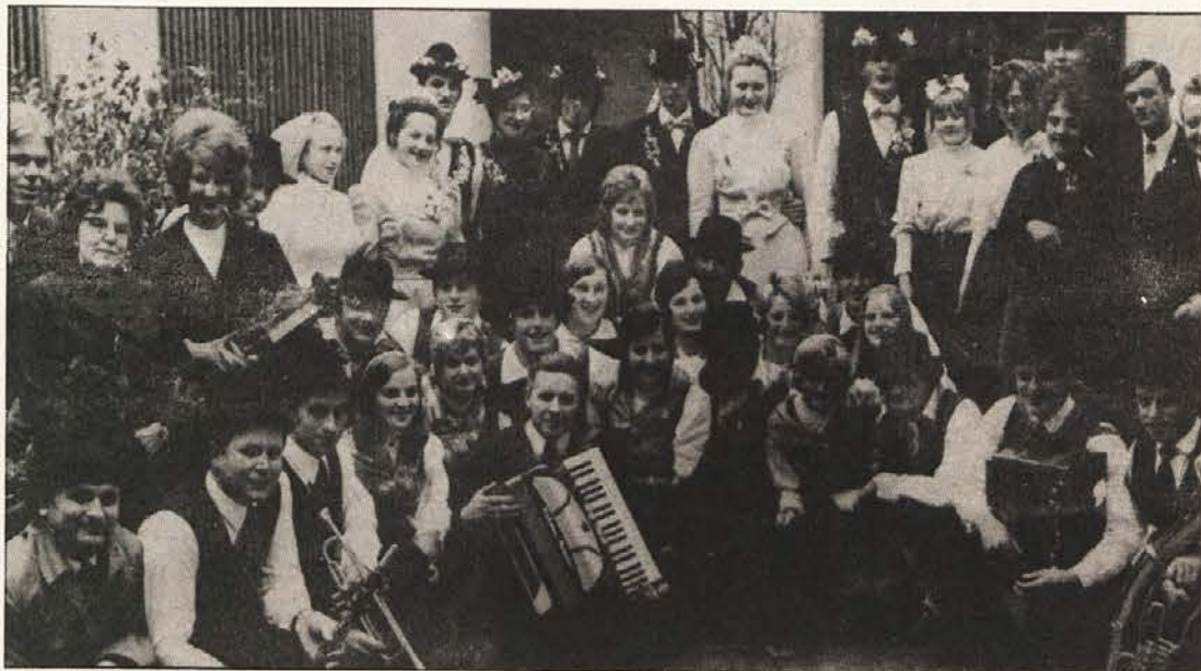
Množičnost in kvaliteta odlikujeta delovanje kapelske Zarje.