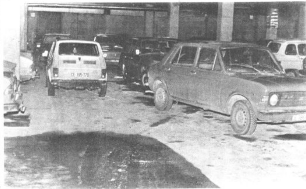
Ceprav se ubadajo s problematiko pokritih parkirnišč že nekaj let, reda na njih še vedno niso uspeli vzpostaviti