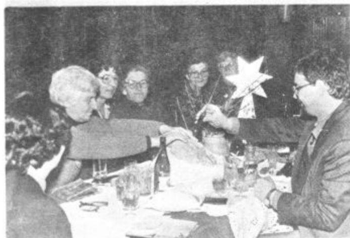
Predstavniki zgodovinsko etnološkega krožka so predstavili tradicionalne božične jedi