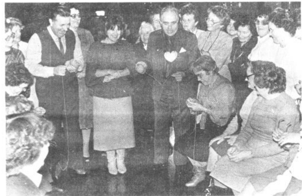
Nad vse zanimive so bile tudi družabne igre