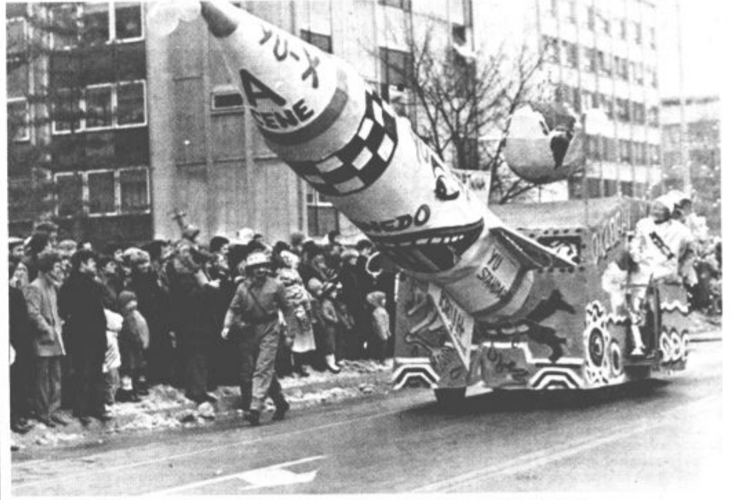
Bomo imeli letos vendarle Pustni karneval tudi v Titovem Velenju?

Več bo treba narediti, poudarja naš sogovornik, tudi na področju kmečkega turizma. Za ta razvoj imamo ogromno možnosti, ki pa jih doslej nismo znali izkoristiti. Občinska turistična zveza bo skušala v sodelovanju s temeljno organizacijo kooperantov Kmetijstvo Šoštanj ugotoviti, kakšen je interes na tem področju. Potem pa bodo seveda pomagali vsem tistim, ki se bodo odločili za uresničitev teh nalog. Izboljšati bo seveda treba tudi gostinsko ponudbo, še posebej, ker poleg zdravilišča Topolšica v občini ni hotela primerne kategorije. O konceptu razvoja turizma, ki je v občini Velenje v javni obravnavi turistična zveza še ni razpravljala, vsekakor pa se bodo v razpravo vključili, saj pričakujejo od tega koncepta in teh usmeritev uspešnejši nadaljnji gostinski in s tem tudi turistični razvoj. Vse bodo naredili tudi, da zgradimo ob velenjskem jezeru kamp. Pred leti smo ga namreč imeli in turisti so se pri nas radi ustavljali. Mnogi ga tudi pogrešajo in so razočarani, ko ugotovijo, da ga nimamo.