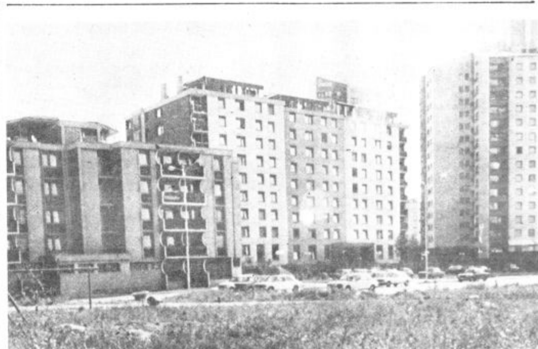
V krajevni skupnosti Edvarda Kardelja, ki naj bi bila urejeno urbanistično naselje, imajo veliko komunalnih težav.

ri odločali, da bodo svoje želene konjčke pustili čez zimo tukaj. S tem pa je prostora za domačine zmanjkalo. Tega pa je že itak malo, saj pripada enemu stanovanju le 0,6 parkirnega prostora. Na parkirniščih pa je tudi še vedno veliko avtomobilov, ki niso v voznem stanju. Krajanji so si dolgo prizadevali, da bi na teh parkirniščih vzpostavili red in med drugim dosegli, da so dobila status pripadajočih parkirnišč. To seveda pomeni, da imajo pravico na njih parkirati le stanovalci, ki določijo tudi red na teh parkirniščih. Seveda pa jim je za to vzpostavitev potrebna pomoč miličnikov in inšpektorjev. Te pa je bilo po mnenju krajanov mnogo premalo, zato tudi načrtovana akcija ni uspela. To seveda pomeni, da na parkirniščih v krajevni skupnosti Edvarda Kardelja še vedno ni reda. Srečujejo pa se še z eno veliko težavo. Pokrita parkirnišča so pogosto tarča nepridipravov. Zaradi tega je v krajevni skupnosti vse bolj pogosto slišati predloge, da bi parkirnišča zaščitili. Nekateri hišni sveti so se teh akcij lotili samostojno, vendar pa so to akcije zaustavili, saj mora biti izpeljana enotno in celovito. Dogovorili so se, da bodo o tej problematiki ponovno organizirali široko javno obravnavo in nato sprejeli usmeritve na skupščini krajevne skupnosti.