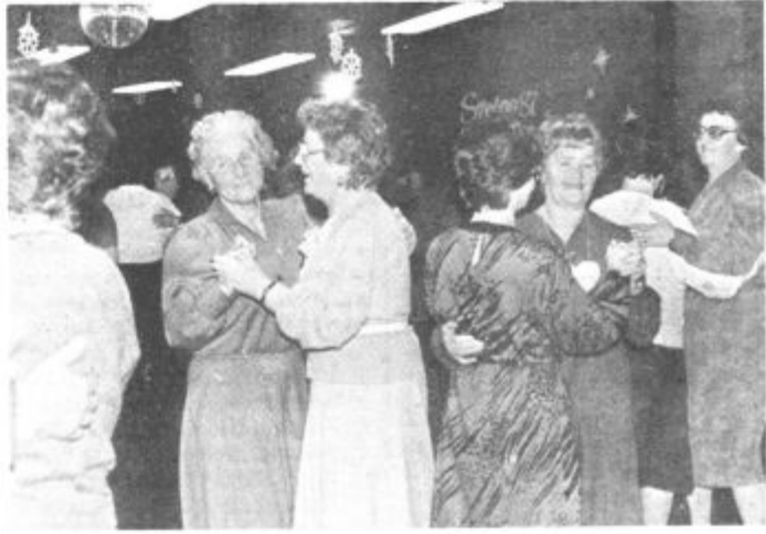
Časa pa je bilo dovolj tudi za ples