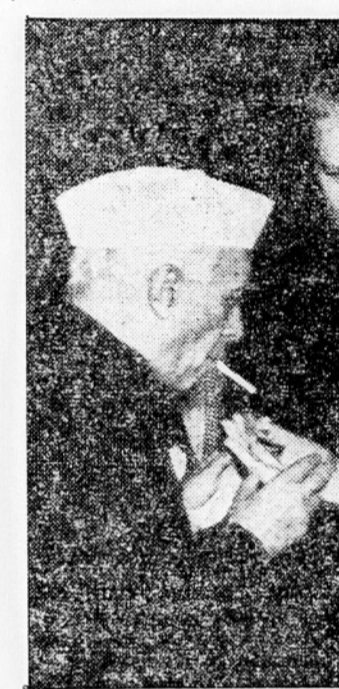
Vodja Jugoslovanske misije Rodoljub Colaković in Jugoslovanski veleposlanik dr. Joža Vilfan pri predsedniku vlade Nehruju

Opoldne se je delegacija srečala s predsednikom Nehrujem in izloča povzročila k njemu na kosilo. Izročila mu je pozdrave maršala Tita in darove naše vlade. Bil je zelo dobre volje in po kosilu so se spet razgovarjali o planu in problemih razvijanja agrarne proizvodnje. Posebne vrste je srečanje s predsednikom republike dr. Rajendrom Prasadam, ki je bil od leta 1920 eden najvišjih sodalcev Gandhija. Predsednik republike tudi v svojem osebnem življenju sledi Gandhijevemu zgledu. Živi skromno, polovico svoje plače vrača državi blaginji. Vstaja zgodaj in pol ure predne na kolovrat. Z velikim zanimanjem je ogledoval preslico v macedonskem