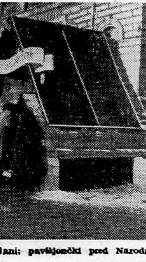
Bojem Novoletne jelke v Ljubljani; paviljoni pred Narodnim muzejem

Beograd, 23. dec. Uredništvi časopisov »Komunistična« in »Partijska izgradnja« sta se sporazumeli, da se časopis »Partijska izgradnja« odslej imenoval »Komunistična«, ker bo ta časopis glasilo CK Zveze komunistov Jugoslavije. Obravnaval bo predvsem organizacijska vprašanja in vprašanja iz tekočega življenja in prakse Zveze komunistov Jugoslavije. Dosedanji časopis »Komunistična« se bo imenoval »Naša stvarnost« in ne bo niti glasilo Centralnega komiteja ZK niti Zveze komunistov Jugoslavije. Obravnaval bo vsa vprašanja našega družbenega življenja.