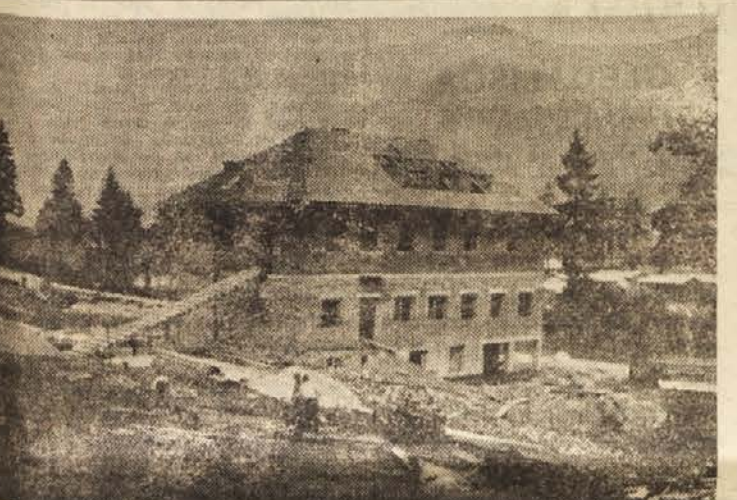
Na Jesenicah gradijo novo strelšče, ki ga vidimo na sliki. V nedeljo popoldne so jeseniški strelci uspešno zaključili Strelski teden. Člani so pokazali razveseljive rezultate. Tisoči obiskovalcev so dokazali, kako priljubljen jim je strelski šport.

Na Telčah pri Trzinu je pred kratkim zasvetila električna luč. K v vasi Gabrijele pri Krmelju so danes niso odstranili stare krajevne tablo na hiši ob glavni cesti z napisom: Gabrijele — občina Trzin, stoz Krški. V Smartnem ob Paki bodo te dni odprti postaja prva pomoči in zborna ambulanta. Smarčanom ne bo treba več hoditi k zdravniku v Zalec. Sočani ali Celje. V Konjski KZ je sedaj zaposlenih več kot 30 delavcev in nameštencev, ki so pred nedavnim ustanovili svojo sindikalno podružnico in izvolili odbor. L. V.