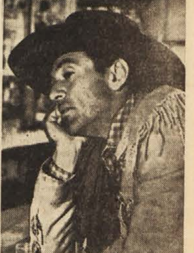
Gary Cooper, nagrajenec »Zlate ostriže«