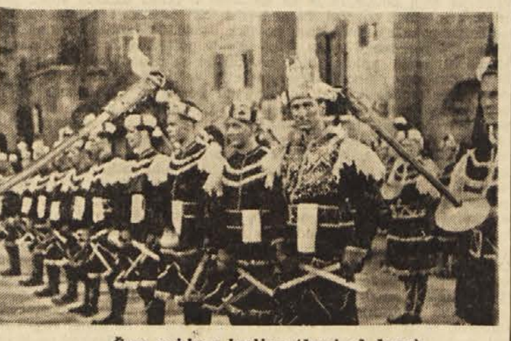
Črna vojska s kraljem (drugi od desne)

Snemanje vseh plesnih skupin je bilo v Trnovem na prostem in sicer ponoči, ker predvideva scenarij za večino plesov večerno razpoloženje. Sredi tega tedna bo nad Trnovem ugasnil nočni vulkan modre svetlobe in noči se bodo umirile. Snemali bodo samo še v obeh ateljejih, nastopali bodo solisti in le tu pa tam bo kak prizor zahteval nekaj statistov, ki so došle v velikem številu dominiral na veseličnem prostoru in ustvarili vdušje množičnosti. Po snemanju na otoku Lokrumu pri Dubrovniku, kjer so morali člani ekipe vzdržati velike napore, je s plesi v Ljubljani zaljučeno najbolj naporno razdobje snemanj, pa tudi najdražje v tem velikem barvnem filmu.