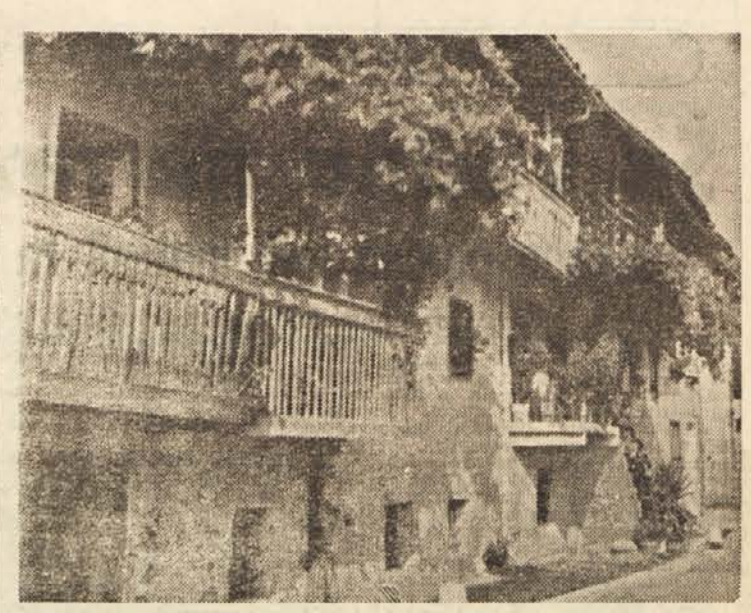
Motiv iz Kobarida

V letošnji sezoni odkupa borovnic so se pojavile na celjskem področju zelo čudne konkurenčne težnje dveh skupin trgovskih podjetij. Pri zbiralcih borovnic sta se znašli hkrati dve odkupni podjetji, Trgovsko podjetje OZZ in »Povrtina — sadje«, ki sta delali pod neenakimi pogoji. To je bilo dovolj, da je nastala pri zbiralcih zmeda, med odkupovalci pa razna trenja, spori in oseb-