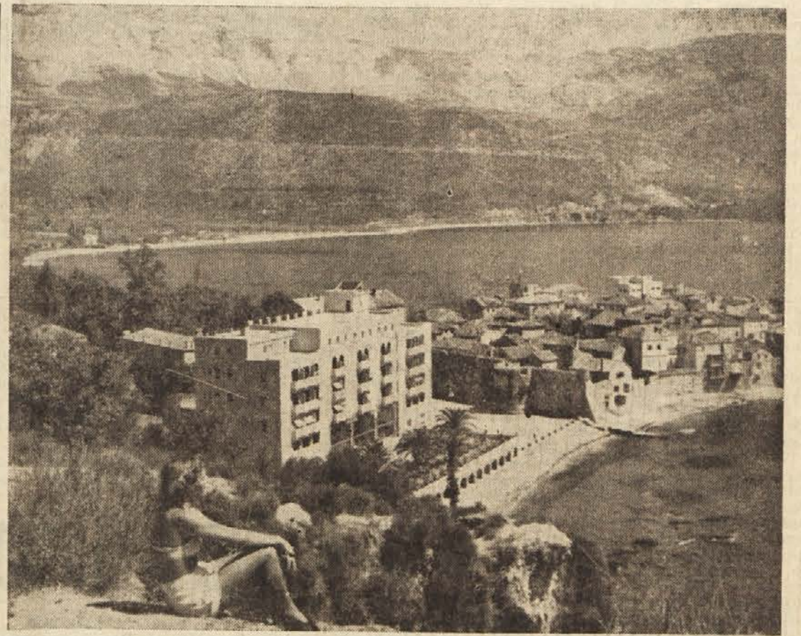
Budva — eno izmed najlepših letovišč v Crnogorskem Primorju