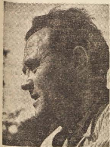
Režiser Fr. Čap

77 dni... od tega 43 po ljubljanskih ulicah, na gradu, na letališču, Tivoliju, na Starem trgu, na Ljubljani in na Iliriji... 43 pa v ateljejih, v luči reflektorjev v Trnovem in na Zrinjskega cesti, kjer je cvetelo drevje še v pozno poletje kar naprej od 15. maja dalje do zaključka 21. avgusta. V zimski sezoni, oktobra ali novembra bo premiera »Vesne«, vesele in zaljubljene filmske zgodbe mladih maturantov