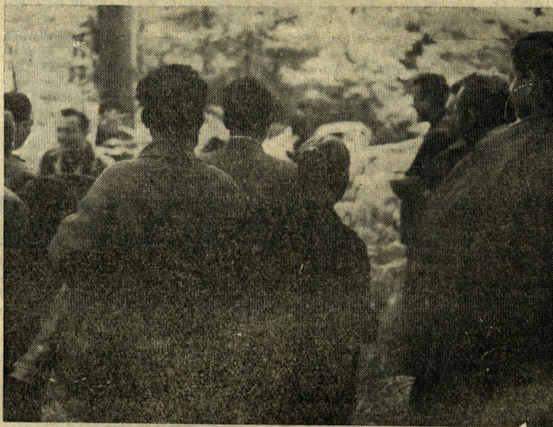
Lovci pred »brlogom«. V ozadju je moč videti »lisico«.