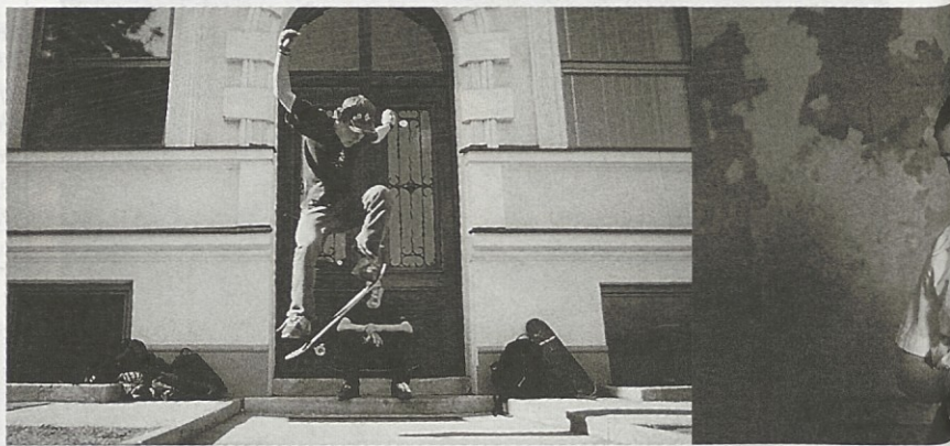
Bolje kot orgazem