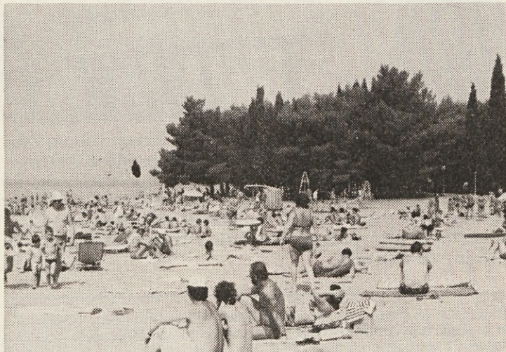
Plaža v kampu 13. maj v Fažani