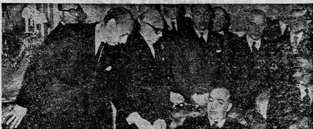
Spor med Argentino in Vatikanom se je zaostрил že preteklega decembra, ko sta prav v času obiska argentinskega zunanjega ministra Remorina v Rimu »Osservatore Romano« in kršćanski demokratski organ »Popolo« ostro napadla Argentino zaradi njene »protiverske borbe«. Neposredni vzrok tega napada je bila uvedba ločitve zakona v Argentini, kar je razbesnelo vatikanske kroge. Remorino je sklical tiskovno konferenco in novinarjem pojasnil položaj, italijanski zunanji minister, liberalec Martino, ki z vso zavezo ni imel nobene opravka, pa se je moral argentinskemu gostu opravičiti. Na sliki v sredini argentinski zunanji minister Remorino med tiskovno konferenco v Rimu.