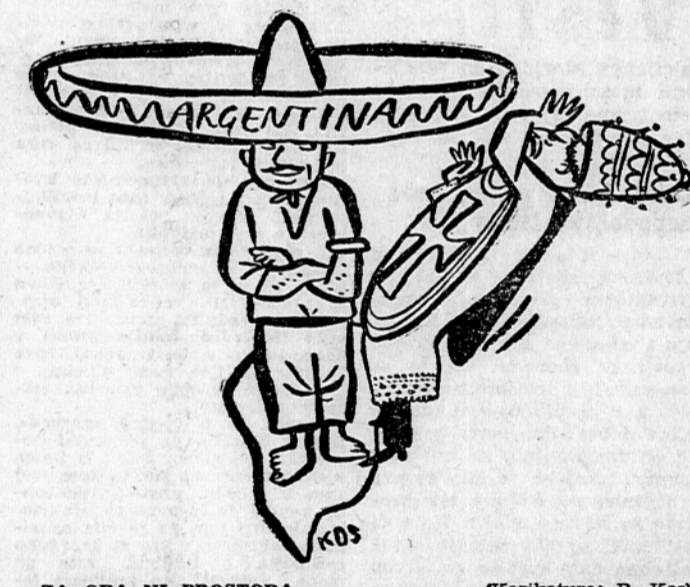
ZA OBA NI PROSTORA

Belgijski klerikalci so si izbrali šole in šolsvo za isto področje, na katerem hujšajo množice tudi takrat, kadar njihova vlada odreče na gospodarskem in socialnem področju. Boj za šole uraja v Belgiji že od leta 1830, ko je provizorična vlada razglasila belgijsko državno neodvisnost. Takrat je vlada razglasila tudi popolno svobodo solskega pouka in tako so se začele poteg državni šol ustanovljati tudi »svobodne« katoliške šole. O popolni solski svobodi govorijo tudi belgijska ustava od leta 1831, ki pa je z nekaterimi spremem-