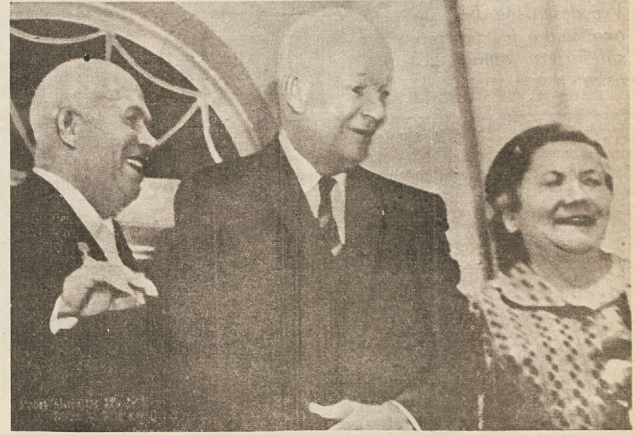
Obisk tovariša Hruščeva v ZDA je izredno velikega pomena za ves svet, zato vlada za potek tega obiska in za razgovore, ki so v teku, veliko zanimanje. Na sliki: Hruščev in njegova soproga, v spremstvu Eisenhowerja, pozdravljata množico Američanov, ki jima je pripravila spontane manifestacije

Govoril je tudi o kolonializmu ter poudaril, da se kolonialistični sistem krha. Podpora, ki jo nudi Sovjetska zveza kolonialnim narodom je decela v skladu s listino OZN. Prav OZN bi morala prva ponuditi roko v pomoč narodom, ki so se pred kratkim osvobodili kolonialnega jarma.