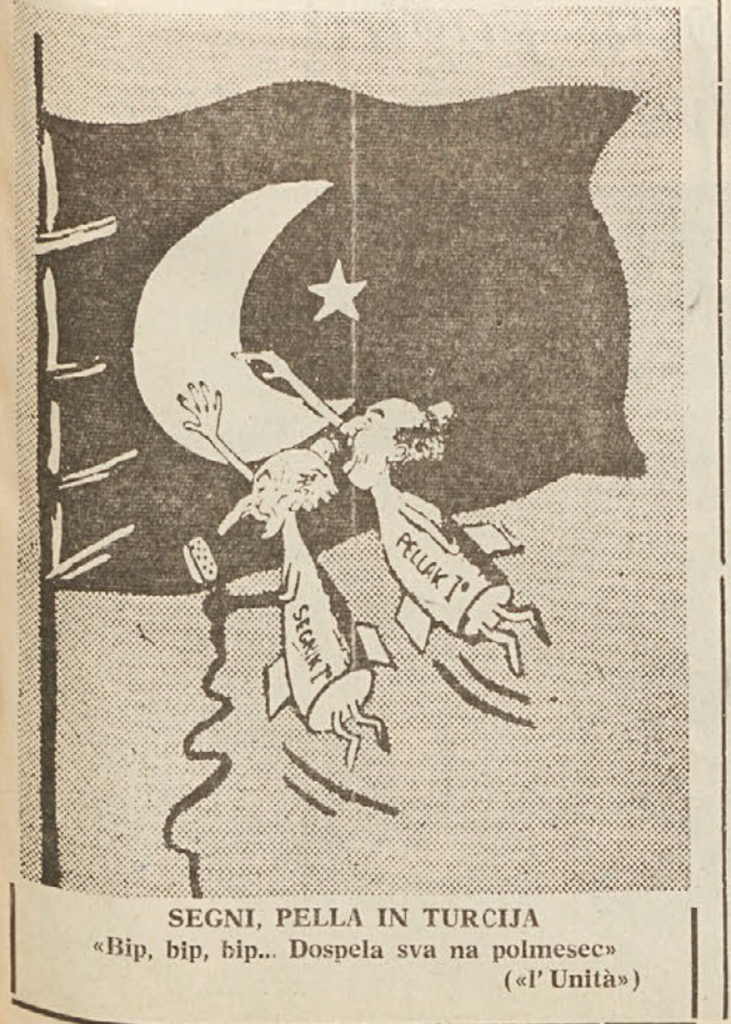
SEGGI, PELLA IN TURCIJA «Bip, bip, bip... Dospela sva na polmesec» (el'Unità)

Zato da ne bodo upanja, ki so nastala v vseh delih sveta in zato, da se nastale možnosti tudi uresničijo, pa je potrebno, da se pomiritve začne izvajati s konkretnimi dejanji, ki bodo odpravila vzdušje in stvarnost hladne vojne. Kar se tiče n.p.r. Italije mora prispevanje k pomiritvi pomeniti predvsem delovanje za ustanovitev širokega evropskega področja brez atomskih izstrelkov in prizadevanja, da se prepreči razstrelitev francoske atomske bombe v Sahari, ki neposredno ogroža varnost in integriteto prebivalstva Sredozemlja ter vsega italijanskega ozemlja in je istočasno orožje izsiljevanja za francoske militariste in Zahod, no Nemčijo.