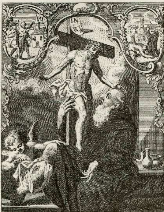
Stara podoba sv. Peregrina na Brdu.

Velik shod je na Brdu o sv. Peregrinu, ki se ga spominjamo dné 27. mal. srpana. Hiša, v kateri se je bilo zgodilo, kar nam narodna pesem