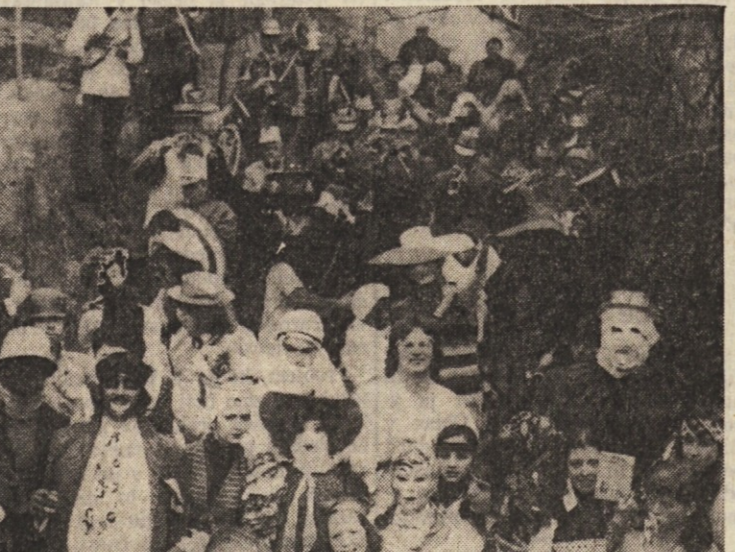
Veselo pustno vzdušje v Boljuncu.

Zabava se je, kot rečeno, nadaljevala v večernih in nočnih urah. Uradnih in neuradnih pustnih plesov je bilo kar na izbiro. Če se omejimo samo na nekatere uradne, moramo omeniti ples v Dijaškem domu, ki ga je priredila domska skupnost, na stadionu 1. maj v prireditvi SZ «Bor», v Ljudskem domu v Križu, v društveni gostlini v Gabrovcu in še kje drugje. Na svoj račun so popoldne prišli tudi mlajši, za katere so priredili puštna rajanja PD «Skamperli» pri Sv. Ivanu, PD «Tabors» na Opčnah, PD «Vodnik» v Dolini in v Križu. Danes se bodo od pusta poslovili in mu marsikje priredili pogreb. Največja slovesnost bo, kot običajno na Proseku.