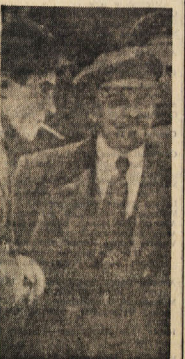
Na tem kongresu je nastalo jedro nove komunistične partije, ki je v šestdesetih letih razvoja dosegla neverjetne rezultate: ruske narode je popeljala skozi tri revolucije, buržoazno-demokratsko 1905 do 1907, februarško buržoazno-demokratsko revolucijo 1917 in veliko oktobrsko socialistično revolucijo ter je zmagala v revoluciji z ustanovitvijo prve socialistične države na svetu. V obeh domovinskih vojnah, ki sta zajeli vse svet, je bila komunistična partija Sovjetske zveze na čelu ljudstva, ki se je borilo za ohranitev svobode in revolucionarnih pridobitev ter obkraj zmago.

Ustanovitve boljševijske partije, krepitve njene vloge in njena odločilna vodilna vloga v pripravljanju in organiziranju zmagovite socialistične revolucije oktobra 1917, ki je odprla novo poglavje v razvoju družbe, v utirjanju novih poti za zgraditev socializma in socialističnih družbenih odnosov — vse to je neolopčljivo povezano z imenom Vladimirja Iliča Lenina.