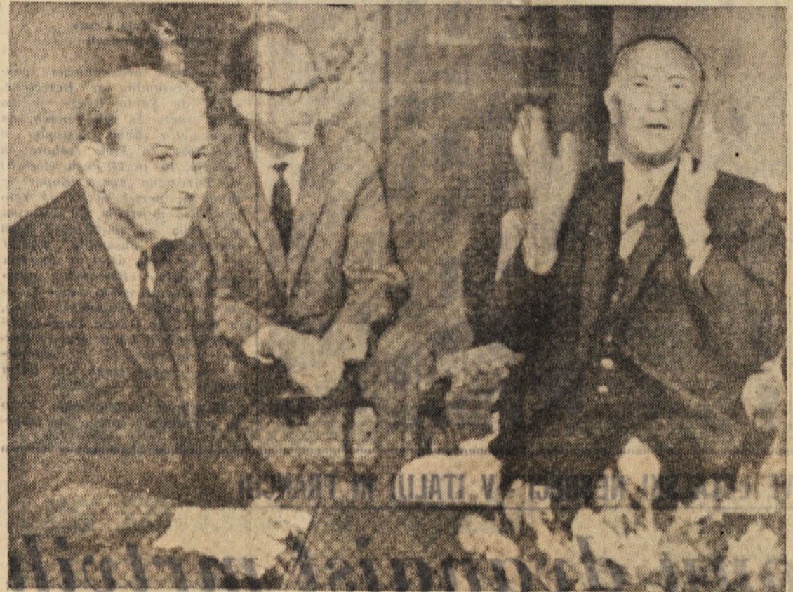
Razgovor Deana Ruska z Adenauerjem v Bonnu

Na koncu je državni tajnik sporočil, da je podal bonški vladi enako obrazložitev. Danes so predstavniki drugih držav podpisali pogodbo v Moskvi, Londonu in Washingtonu. V Moskvi so podpisali predstavniki Laosa, Švedske, Islandije in bivšega belgijskega Konga. V Londonu so podpisali predstavniki Islandije, Malaje, Laosa, Jordana, Trinidada in Tobaga. V Washingtonu pa so danes podpisali predstavniki Jordana, Urugvaja, Islandije, Trinidada, in Tobaga, Švedske, Laosa, Libanona in Nikaragve. Do danes je v Washingtonu podpisalo pogodbo 47 držav v Londonu okoli 50, v Moskvi pa 37. Pariški tisk danes še posebej komentira nemške napovedi o pridružitvi k moskovski pogodbi. Naslovi časopisov so na primer