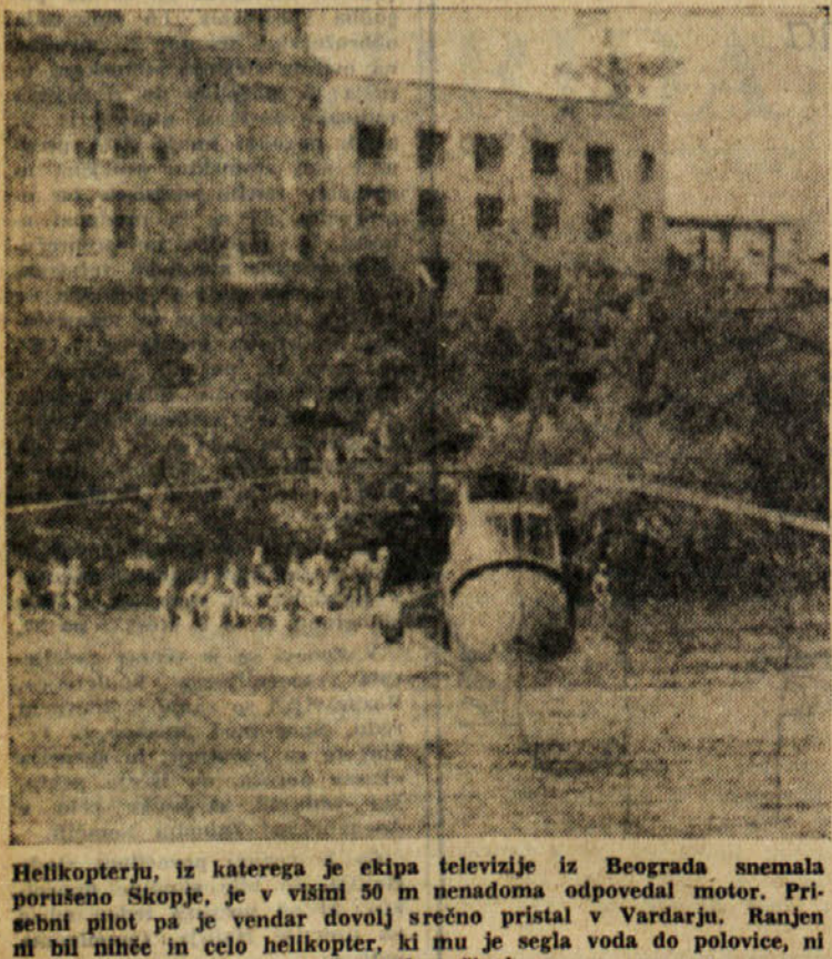
Helikopterju, iz katerega je ekipa televizije iz Beograda snemala porušeno Skopje, je v višini 50 m nenadoma odpovedal motor. Pribešni pilot pa je vendar dovolj srečno pristal v Vardaru. Ranjen ni bil nihče in celo helikopter, ki mu je segla voda do polovice, ni ut

GENOVA, 12. — Velik požar je preteklo noč nastal v tovarni čokolade »Scars«. Skode bo gotovo več kot sto milijonov.