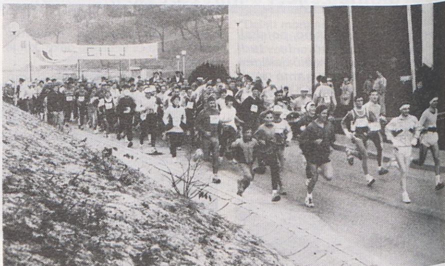
Množična udeležba na 9. novoletnem teku v Topolšici

Kljub vsemu so letos pripravili ob tekih za otroke in odrasle še več spremljajočih akcij ter tek s podelitvijo priznanj priredili v zadovoljstvo večine udeležencev.