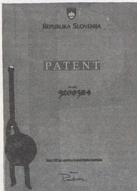
Patent številka 9200384 Priprava na kalupu za oblikovanje celic hladilnega sistema