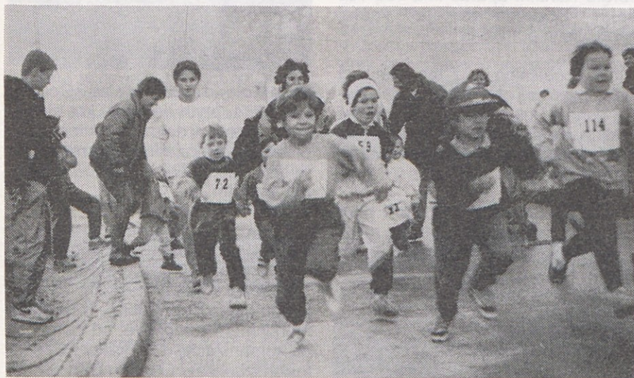
Posnetek je zgovoren dokaz o priljubljenosti novoletnega teka

Seveda so bili najbolj zadovoljni prav mladi tekači, ki so dobili za najboljša mesta kolajne, medtem ko so najboljšim tekačem v starejših kategorijah namenili denarne nagrade, sredstva pa so namenili kar iz zbrane štartnine.