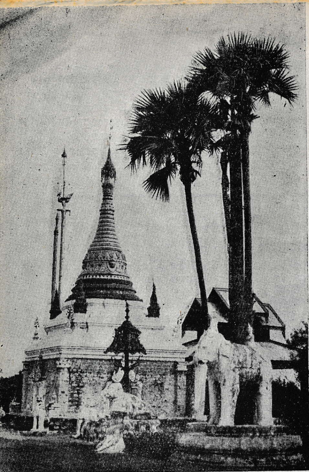
Mandalay (Birmanija): Budistovska pagoda.

benega nadziralca, nobenega urnika. Eden ali dva izmed starejših, pa ne najboljše, sta strahovala manjše; večji pa si niso dali ukazovati od nikogar. Učili se niso nič. Spali so, kjer in kakor je kdo hotel. Vse luknje, vsi koti v hiši so jim bili na stežaj odprti. Hrana je bila slaba in v nerednih obrokih. Prve štiri dni, ko smo prišli, ni bilo nič zajtrka, pa se nihče ni čudil, nihče ugovarjal. Kdor je imel kakšen krajcar, je skočil k prvi branjevki in si tam postregel. Sploh so fantje lahko brez kontrole hodili iz zavoda, zunaj so lahko ostali noč in dan, ne da bi jih bil kdo vprašal, kje so bili. V cerkvi so se tudi zelo pomanjkljivo obnašali. Molili so prav malomarno. K angelski mizi ni pristopil prve štiri dni nihče. Tega je bilo krivo najbrž tudi to, da so imeli pre-