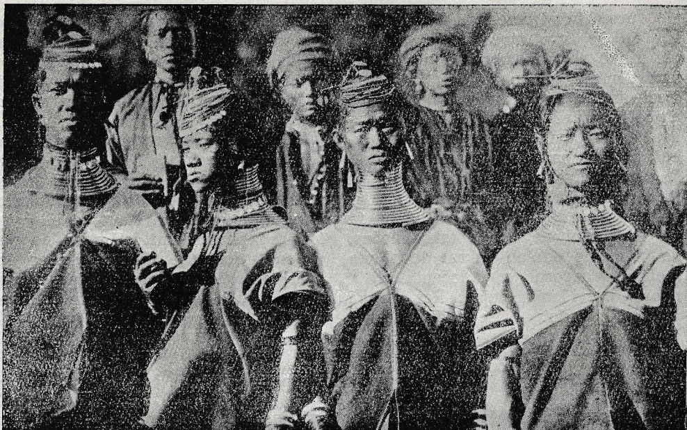
Mandalay (Birmanija): Burmanske lep otlice z dežele v svoji praznični opravi.

varnosti odstraniti, če se v skrajnih okoliščinah dovoli nepopolna ločitev zakonskih, to je tako zvana ločitev od postelje, mize in sobivanja, ki pusti zakonsko vez samo nedotaknjeno in ki jo z jasnimi besedami dovoljujejo kánoni cerkvenega prava. Določiti vzroke, pogoje, način in jamstva take ločitve, da se zagotovi blagor rodbine ter preprečijo vse neprilike, ki pretijo zakonskemu drugu, otrokom in splošni blaginji, je stvar cerkvene postavodaje in deloma tudi svetnih postav, namreč glede na državljanske zadeve in učinke.