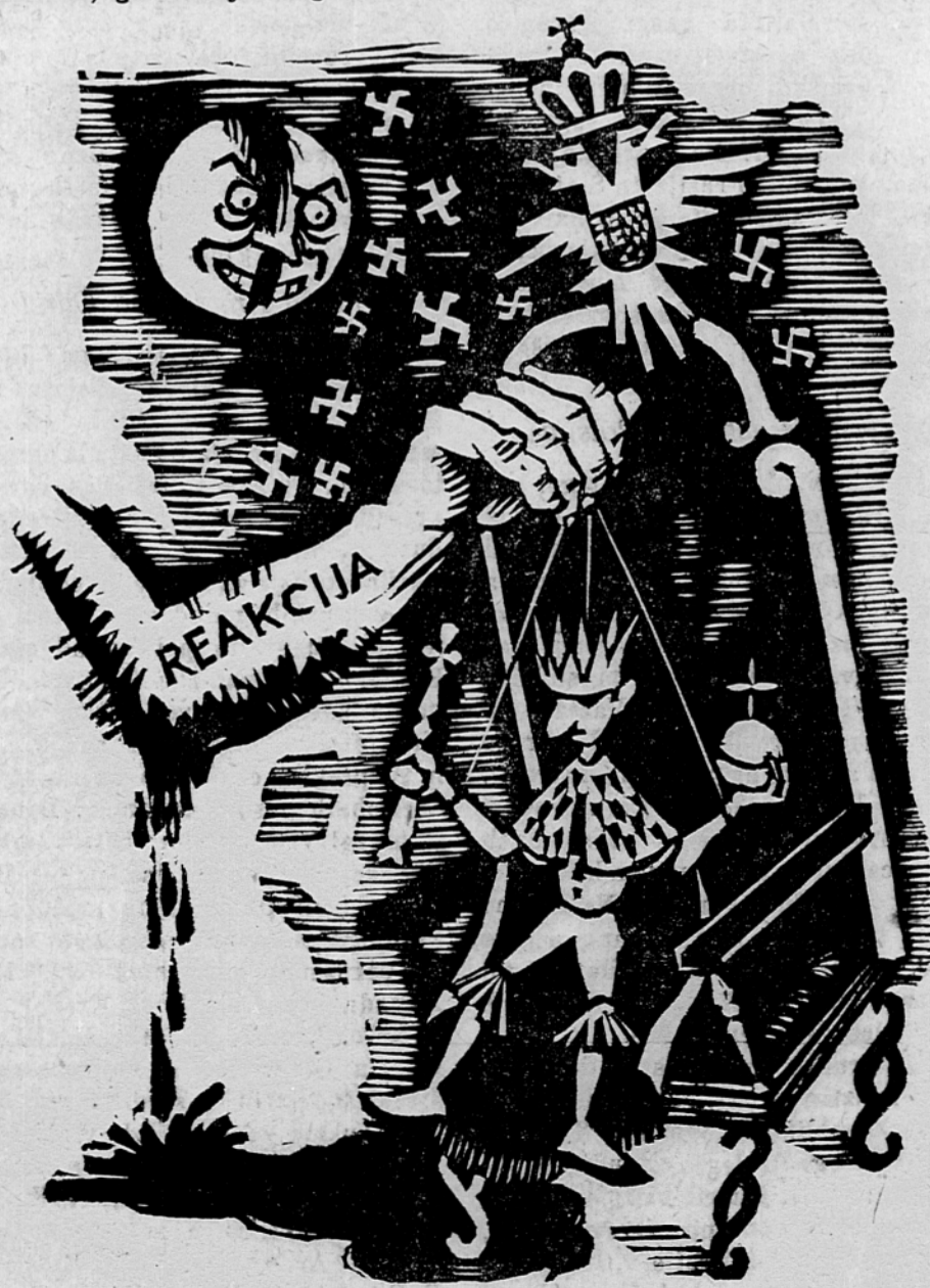
Peterčkove poslednje sanje

Tudi Jugoslovanske ladje v ameriških pristaniščih so po odobri dvignile zastave s peterokrako zvezdo. Po poročilu vršilca dolžnosti načelnika jugoslovanskega pomorskega irca v Ameriki je odredbo izdala dirčica pomorske službe pri vladi dr. Šibašiča.