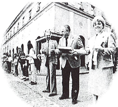
Simbolična Živa veriga selitve gradiva iz stare stavbe v novo stavbo UKM – 4. oktober 1988