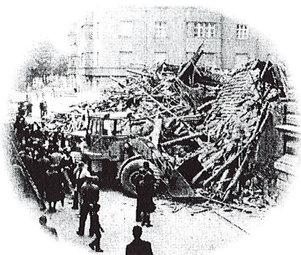
Rušenje stavbe na Orožnovi 15. maja 1981 ob 12.30, kjer bo stala nova stavba UKM

In nova stavba UKM meji na eno najmanjših ulic v mestu, ki nosi ime verjetno največjega svetovnega jezikoslovca dr. Frana Miklošiča, ki je tudi 18 let bil pomemben bibliotekar na dunajski dvorni knjižnici.