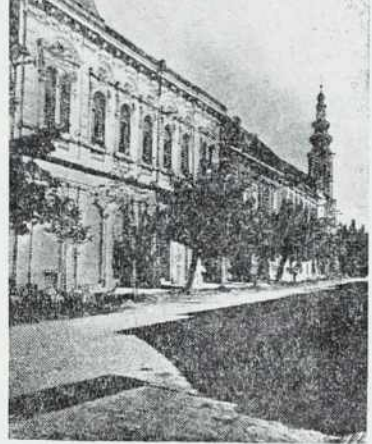
Lendava — Partizanska ulica

Učiteljski stanovanjih, ki jih je nujno potrebno izboljšati. V Dolnji Bistrici bodo za stanovanja preuredili nerabne šolske prostore. Pri vseh omenjenih težavah pa bi bilo prav, če bi jim pomagal Okrajni socialni zavod in pa množične organizacije.