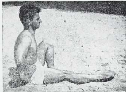
»Vedna telovadba krepi telo in izposablja človeka za premaganje težav na življenjski poti. Zdej — o spomladanskih lneh — se bo naša mladina »reselila iz telovadnic na prosto — o objem narave in toplo »ožajajočih sončnih žarkov. In se več bo uric veselja in doživljenj!«

Menda ni organizacije ali društva v mestu, ki bi tako močno občutila potrebo po gradnji kulturnega doma v prekmurski metropoli, kot prav društvo naših telovadcev. Njihovo telovadnico sedaj uporabljajo mnoga društva in organizacije za sestanke, kulturne prireditve in celo veselice, kar samo kromi in ovira nemoteno vadbo telovadnih. Koliko vadihu ur je bilo izgubljenih in kolikokrat so se morali telovadci raziti, ker se je v njihov prostor vselil ta ali oni prireditelj? Društveni voditelji celo povedo, da so bili v lanski sezoni približno štiri mesece brez telovadnice — boljše s telovadnico, ki pa je bila zasodena po drugih. Odtod tudi njihova odločitev, da bodo po svojih močeh pomagali pri gradnji kulturnega doma. V društvenih in telovadnih vrstah je lani šepala tudi disciplina, kar je bilo občutljivo zlasti na večjih nastopih, ko so se posamezniki oddvajali od množice nastopajočih in niso prispevali svojega deleža k