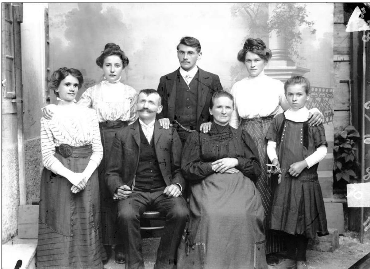
Pelikanova fotografija sicer ne upodablja prebivalcev hiše 269, ampak eno od številčnih idrijskih družin leta 1911

že ta ne kapucinski, ampak sokolski brat piše. 63 Če zanemarimo očitno nazorsko opredeljenost avtorja, lahko iz zapisa zaznamo vsaj dvoje – da je bil Josip že član Sokola – leta 1906 ga najdemo tudi že na seznamu udeležencev vseskolskega zleta v Zagrebu 64 in da je priimek, drugačen od Schmeilerjevega, v okolju vzbujal pozornost.