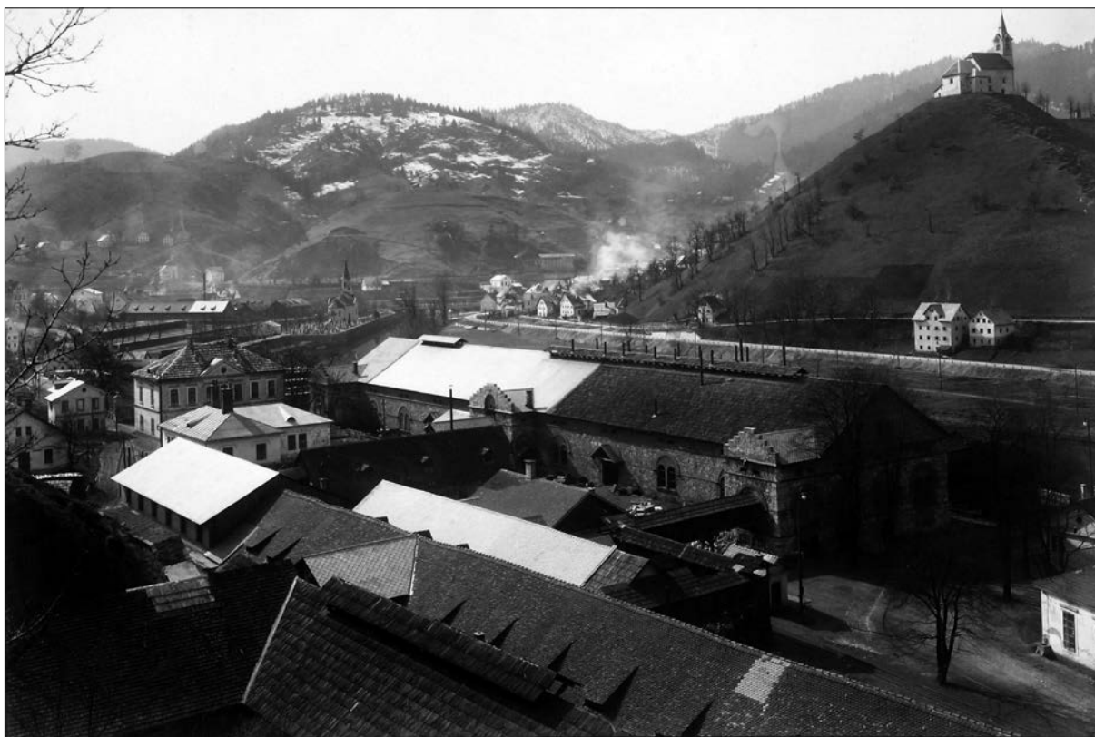
Idrija je bila v začetku 20. stoletja slikovito mesto

do izteka 19. stoletja sled pustili tisoči bolj ali manj anonimnih prebivalcev, pa tudi nekaj evropskih izbražencev, denimo Giovanni Antonio Scopoli in Baltazar Hacquet. Izobrazba in znanje sta bila v Idriji vedno visoko cenjena, 40 mesto pa je bilo zaradi svoje poglobitve dejavnosti tudi navzven živahno in zanimivo. Pomen znanja ponazarjata zgradbi ljudske šole in realke, ki sta v kraju z izrazito omejeno količino talne površine dobili zares impozantni poslopi.