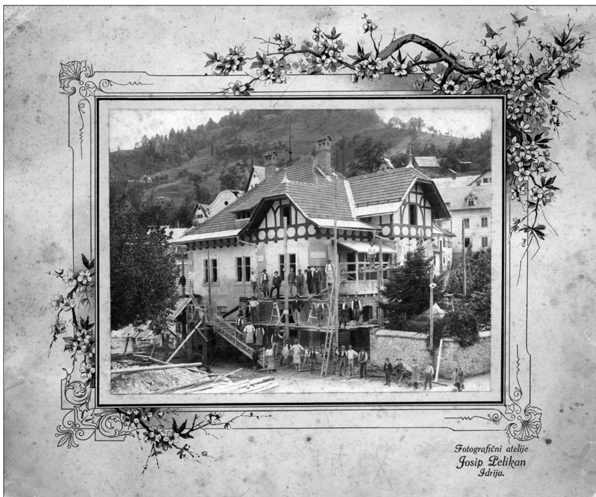
Gradnja novega poslopja gozdarske uprave v Idriji, po 1912

robovih gradil rudnik. Nad mestom je dominiral grad Gewerkenegg iz leta 1525, v katerem je delovala uprava rudnika, na drugem koncu je veduto zaznamovala cerkev sv. Antona s križevim potom iz leta 1678. Na osrednjem trgu je stala cerkev sv. Barbare, nekaj višje pa cerkev sv. Trojice, povezana z legendo o nastanku mesta. Leta 1876 je bilo zgrajeno veliko poslopje rudarske ljudske šole, leta 1898 so zgradili mestno hišo in leta 1903 realko. 45 Mestno veduto in življenja Idrijčanov so zaznamovala poslopja mnogih rudniških objektov nad površino in več nivojev rofov pod njo. Družabno življenje so ob relativni poklicni povezanosti krepila razna društva – čitalnica je bila ustanovljena leta 1866, Dramatično društvo leta 1889, Sokol leta 1897. Idrijska podružnica Slovenskega planinskega društva