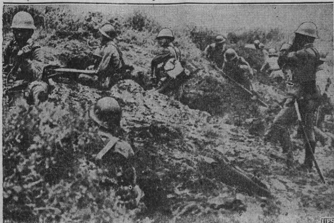
Bojna linija Japoncev nekje blizu mesta Peipinga, proti kateremu so z vso previdnostjo prodirali. Med tem časom je to mesto že padlo v njih roke in sicer brez vsakih bojev.