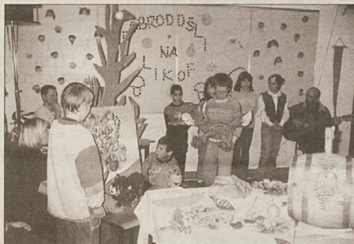
Še en iz niza nastopov...