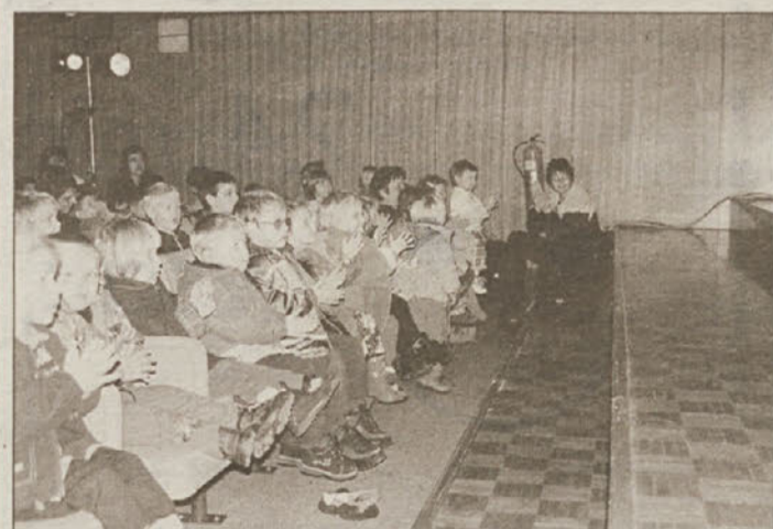
Otroci so navdušeno spremljali predstavo.

No, posavski otroci pa so ga lahko že spoznali skupaj z njegovo priljubljeno predstavo "Dogodivščine vajenca Hlapiča". Tokrat je, kot rečeno, Robi brežiške malčke razveseljeval z "Žabjim kraljem". Predstava, ki so si jo ogledali, pa je imela tudi humanitarni značaj, saj je bil del sredstev namenjen v "Sklad za ograjo".