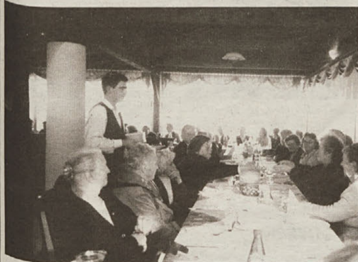
Prvo srečanje naj bi postalo tradicionalno.