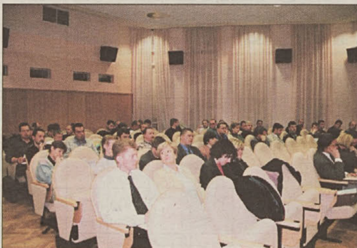
Od 63 delegatov se jih je zbralo 59.

Na vse te težave pa je opozoril tudi karikaturist Stanko Šerc s priložnostno razstavo. S.V.