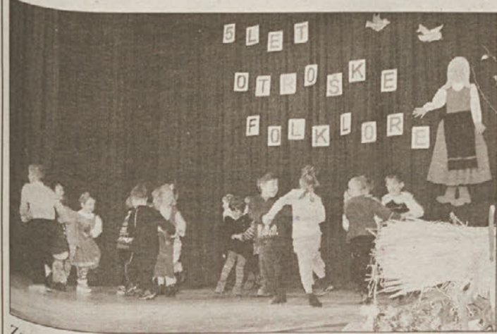
Za uvod so zapeli in zaplesali najmlajši.

peto obletnico delovanja. Tako so se zbrali v tamkajšnji kulturni dvorani številni obiskovalci, da skupaj z mladimi folkloristi obeležijo jubilej. Pridružila se jim je