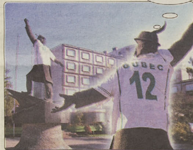
Tudi velecenjeni gospod M. Gubec se je dodobra vživel v nogometno dogajanje tiste "strašne" srede. Da bo učinek popoln, je potrebna tudi primerna garderoba. Dres je bil na njem kot ulit.

Halo, kolega, umakni se...ne vidim! Uf,pazi...gol....gooooo!!!!...Rudonja... in goool...saj to ni res....!!!