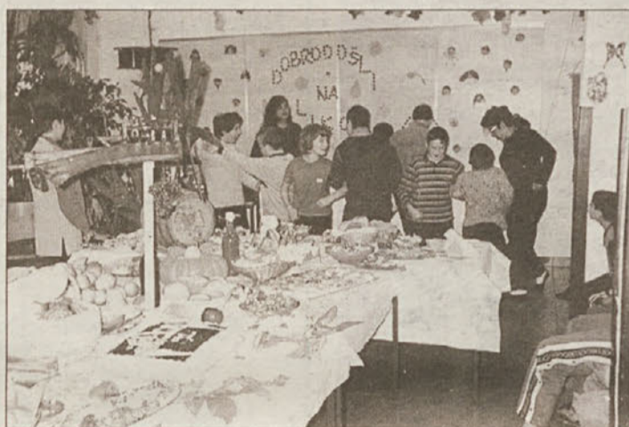
K zabavi sodi tudi ples...