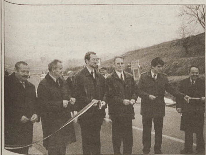
Odprtje ceste Škocjan - Zavratac

Občinski svet je na eni zadnjih sej sprejel sklep, da se k izdelavi ureditvenega načrta za naselje zaton pristopi takoj, pri čemer naj bi območje preuredili v trg, del magistralne ceste Brestanica - Krško od križišča pri Taverni do semaforiziranega križišča pa bi bil potreben rekonstrukcije zaradi podaljšanja tretjega pasu za leve zavijalce na most.L.P.