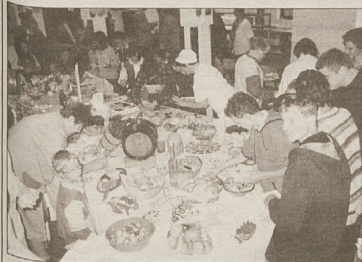
Priprave na likof in obložene mize...