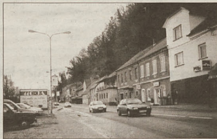
Prebivalci naselja Zaton so poudarili, da je življenje ob tej cesti smrtno nevarno, predvsem za otroke, saj iz svojih vhodov stopijo na zelo prometno cesto.

Stanovalci naselja Zaton v starem delu mesta Krško so se že v začetku leta 1999 s pismom obrnili na Občino Krško s prošnjo, da skupaj s strokovnimi službami preučijo možnosti preusmeritve magistralne ceste proti koritu Save, s čimer bi cesto oddaljili od njihovih hiš in dvorišč.