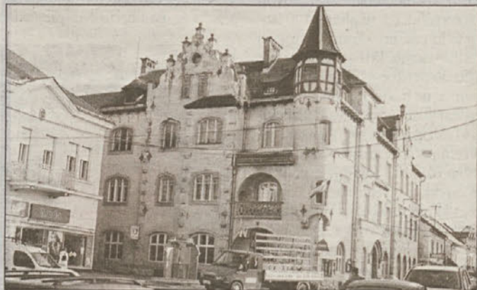
Ker pravdanja nikoli ne zmanjka, se hiši obetajo boljši časi.