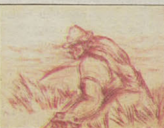
Kosec, rdeča kreda na papirju