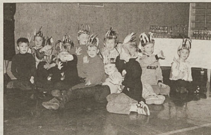
Ob podpisu pogodbe za izgradnjo nove OŠ v Piščah so imeli "glavno" besedo otroci, ki že komaj čakajo prihodnjo jesen.

Pišce - S prijetnim kulturnim programom so v Piščah proslavili podpis pogodbe za izgradnjo nove osnovne šole, ki naj bi svoje učence sprejela že prihodnjo jesen. Hkrati pa gradnja šole pomeni v tej krajevni skupnosti naložbo stoletja, v katero plačujejo samoprispevek za njeno izgradnjo tudi krajanje. Z deli naj bi začeli že v tem mesecu, seveda če bo vreme naklonjeno, šola pa naj bi bila dokončana čez slabo leto dni. Skupno bo stavba merila 1700 m 2 .