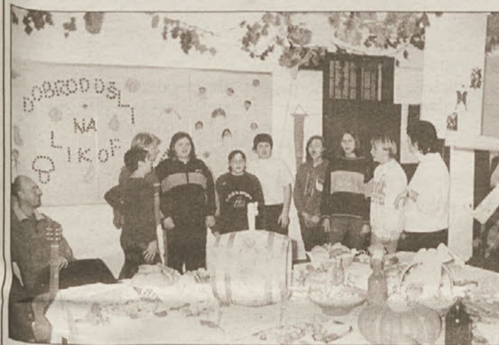
Predstavili so se tudi pevci...