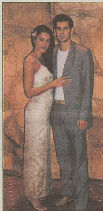
V Sun Cityju s fantom Sandijem

nikova žena odzvala na humanitarno akcijo, ki jo sama načrtuje v januarju v Posavju za pet najrevnejših slovenskih družin. S.V.