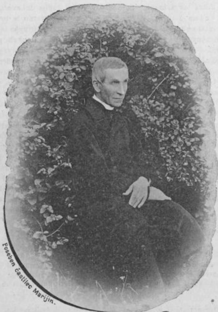
Poseten častilec Marijin.

O, ko bi moglo govoriti zidovje neštevilnih Marijinih svetišč! Vsak kamen bi nam vedel povedati, koliko ozdravlencev je že tu hvalilo