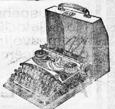
Telefon štef. 2263