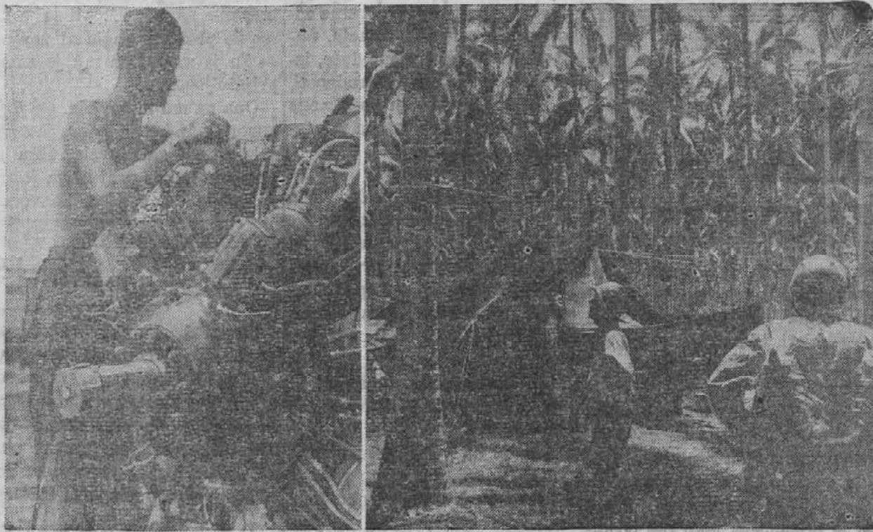
Na levi je vojaški mehanik, ki pregleduje motor letala, ako je slednji v redu, ker od motorja je odvisno življenje letalcev. Na desni pa je prizor iz taborišča marinov na Guadalcanalu.

li smo zadnje dni dolgo govorov Paveliča, Nedića Markovića, Solca, Tassa Dinića in drugih, manj važnih Hitlerjevih pomagačev. Kar so govorili, bi bili mogli reči tudi francoski fašisti v Vichy-ju.