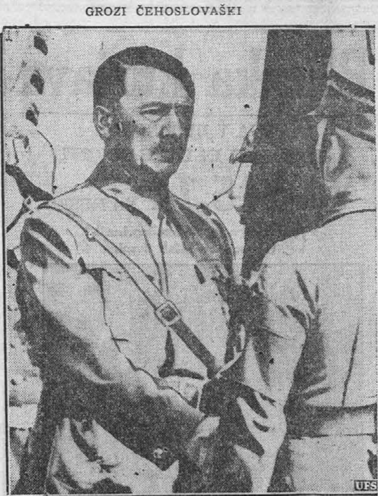
Adolf Hitler, s svojim običajnim srditim izrazom na obrazu, ki je zadnji ponedeljek zagrozil, da bo korakal na Čehoslovaško, ako zlepa ne bo dobil, kar zahteva.

Osebo poznam odvetnika dobrega katoliškega moža in zvestega pristaša Schuschnigove vlade. To je bila njegova edina krivdava. Zato so mu pa vzeli advokaturu. Mož nima premoženja. Od česa naj živi on in družina. Žena ima v Ljubljani starše, ki je ne morejo podpirati z denarjem, so pa pripravljene dati družini potrebne hrane, ako pridejo v Jugoslavijo. Odvetnik prosi dovoljenja za izselitev. Ko mu to neusmiljeno odbijejo vpraša od česa naj živi. Ali veste, kaj so mu odgovorili? Tako kakor bi odgovoril kak Neron ali Kaligula: "Kaj nam pa to mar? Ako ne morete živeti pa crknite."