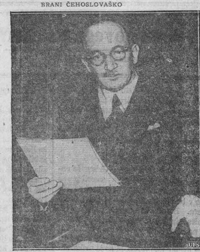
Edvard Beneš, predsednik Čehoslovaške, ki je odločen, da bo z armado branil svojo državo proti Nemčiji, pri čemer upa na pomoč demokratičnih držav in Rusije.