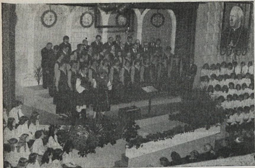
Na sredi zbor „Gallus“, ob straneh pa mladinski zbori iz Castelarja, Ramos Mejije in San Justa na predvečer zlate maše.

liji, spremljali čez ocean v neznanost, skozi dolga leta prilagajanja novim razmeram in ljudem, spremljali skozi vse probleme, ki so bili in so s tem v zvezi. Kdo nas bolj pozna kot Vi, kdo bolj razume, kdo je bolj seznanjen z vsem bremenom begunstva in zdomstva?