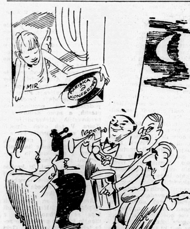
PO PRVIH AKORDIH: — Saj se ne izplača začeti, gospoda, če mislite spet ono staro iz 51. leta. Karikatura: M. Bregar

Medtem ko Francija o svojem sporu s Španijo uživa podporo Velike Britanije — kateri boče Franco izteati Gibraltar — na parviski danisnik evropskega lista »Al Gambia« poroča, da so ZDA izzvale svoje nezadovoljstvo in opozorile Francijo proti morebitni prekinitvi diplomatskih stikov s Španijo. Čeprav je malo verjetno, da bi maroški spor, ki je že presegel okvir francoskošpanskih odnosov, lahko povzročil resne posledice v odnosih med tremi zahodnimi velesilami, pa bodo vsebator ZDA — kakor piše celo »New York Times« — zaradi podživanja Francoskih ambicij z zvezo, ki jo so z njim sklenile, nosile del odgovornosti za posledice njegovih korakov.