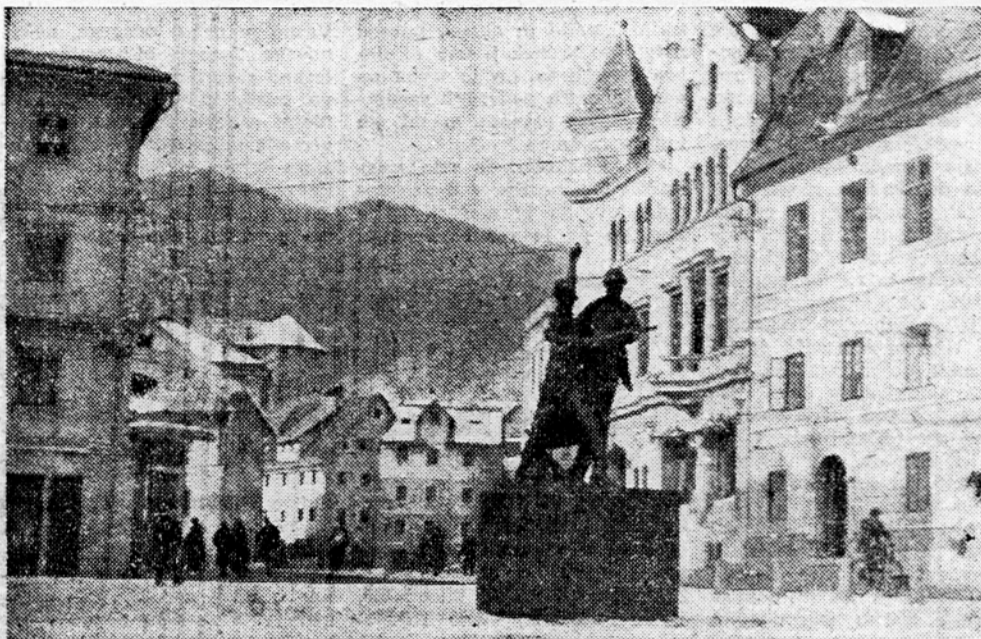
Preurejen lirijski trg s spomenikom borcev narodnoosvobodilne vojne. (Na četrti strani objavljamo članek o lirijskem rudniku pod naslovom »Tih, toda bogata dolina«.)

Zvečer se je francoski zunanji minister Bidault sestal z zunanjim ministrom Molotovom v prostorih sovjetske komandature. Izredni avstrijski poslanik dr. Schönher pa je imel razgovore z drugimi člani sovjetske delegacije.