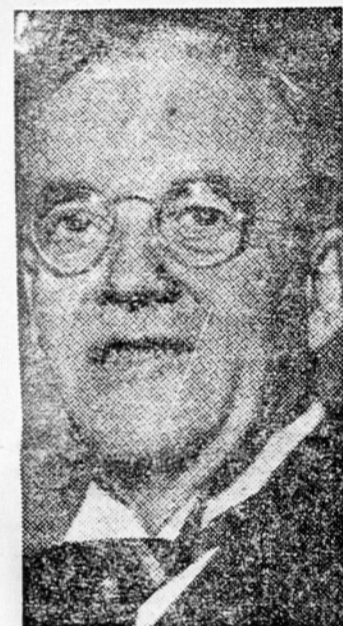
John Foster Dulles

Glavni del Dullesovega govora, ki je trajal skupno 17 minut, je bil posvečen odgovoru na Molotovo izjavo. Dulles je točko za točko odgovarjal na sovjetske obtožbe proti zahodnoevropski obrambni skupnosti, proti ameriški politiki v Evro-