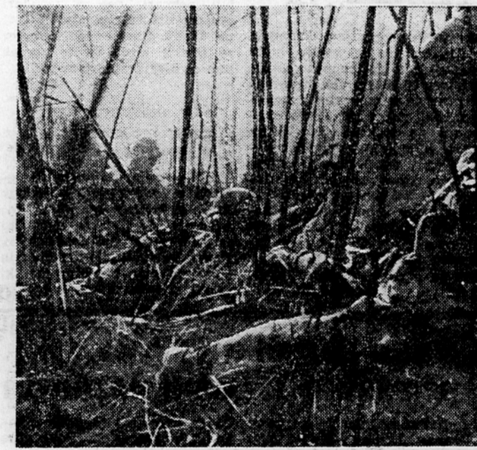
HANOI, 26. jan. V francoskih vojaških krogih v Indočini pričakujejo napad Ho Si Minhovih sil na utrjen položaj pri Dien Bien Fuju v pokrajini Tal. Po izjavah predstavnika glavnega štaba francoske — Bao dajevih sil se obroč Ho Si Minhovih divizij pod poveljstvom generala Giapa vedno bolj zojuje okrog Dien Bien Fuja tako, da bo pristop k letališču kmalu omogočeno in francoske sile ne bodo mogle več vzdrževati vzračnega mostu med Hanoiem in Dien Bien Fujem. V vojaških krogih sicer menijo, da bi se tudi v tem primeru odpor Dien Bien Fuja lahko nadaljeval je več dni, ker ima tamkajšnja garnizija za teden dni hrane in streliva. Na sliki: francosko — Bao Da jeve enote na položajih pri Dien Bien Fuju.